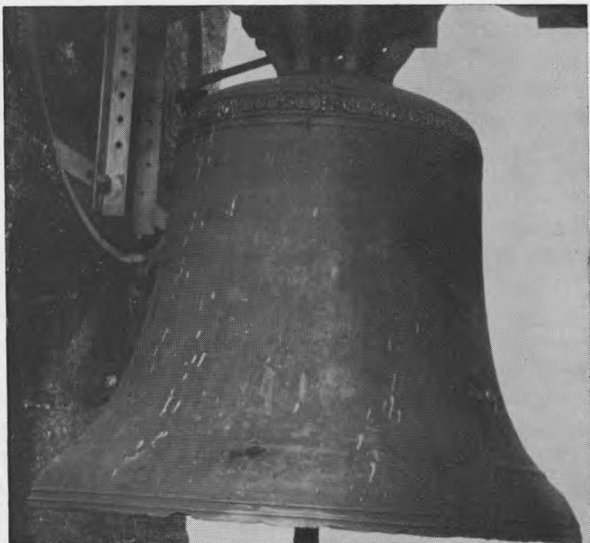
De Vlaamse klok van Pencran uit 1365.