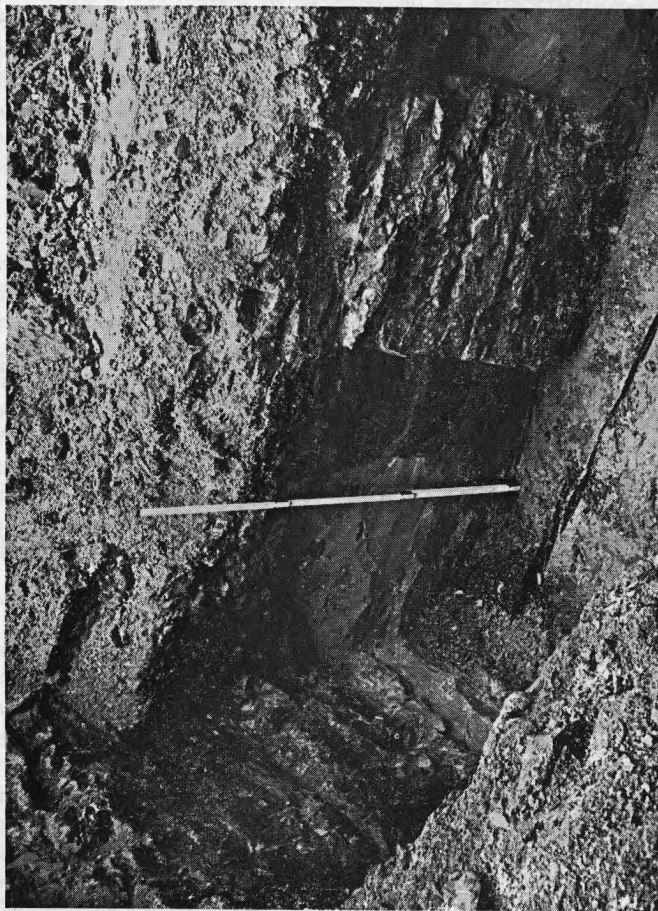
Funderingen van de middeleeuwse kelder op de Markt te Brugge. Links, voorgevel; rechts, pijler.