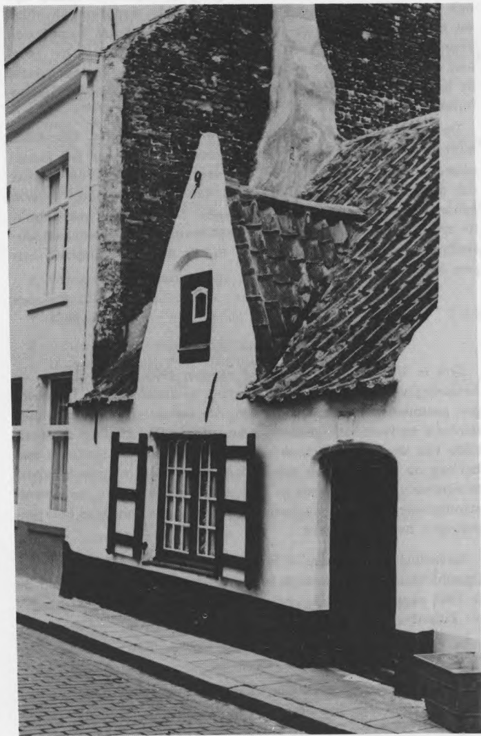
Vissershuisje, Blankenberge, Breidelstraat