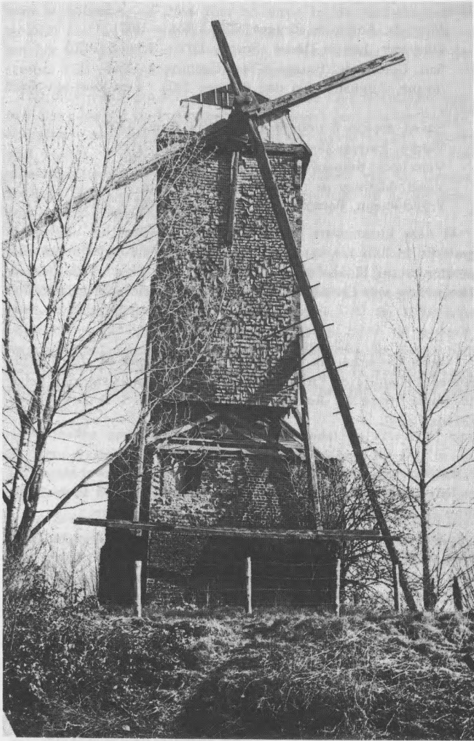
Molen te Geluveld