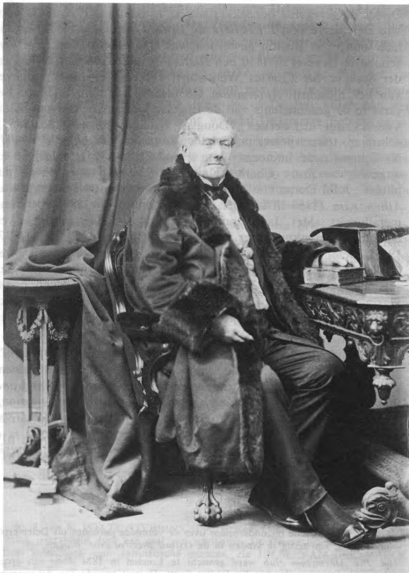
J.O. Delepierre in de jaren 1860