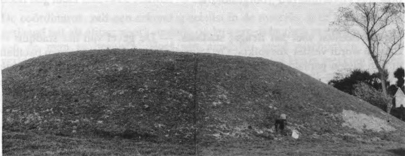
De Hoge Andjoen-motte te Werken met rechts (rond de kerk) het voorhof.

De opgravingen startten met een 3 m brede verkenningssleuf in het westelijk deel van het voorhof. De bewoning nam hier een aanvang in de late steentijd. Voor deze faze herkennen we een zeer dunne bewoningslaag met verschillende silixfragmenten, maar geen structuren. Duidelijker zijn de sporen (kuilen, palen), die volgens de ceramiekvondsten aan de Romeinse periode moeten worden toegewezen. Er is geen aflijnbaar stratigrafisch verschil tussen de Romeinse bodem en de vroegmiddeleeuwse. Aan deze bodemlaag kunnen meerdere structuren worden gekoppeld, waaronder 2 hutkommen en een houten afsluiting de voornaamste zijn. De bodem wordt naar de rand van het latere voorhof begrensd door een ongeveer 4 m brede en 1,25 m diepe gracht. Boven dit geheel vinden we een laag die overgaat in