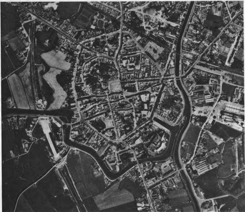
Vertikale luchtfoto (met toelating van het Ministerie van Openbare Werken en het Ministerie van Defensie) van de stad Veurne. Men herkent ten noordwesten van de markt de cirkelvorm van de oudste versterking.

Evoluties zijn meestal het best te volgen wanneer de fazen ervan in direct contact staan met elkaar. Dus het beste overzicht van de ontwikkeling van de aarden versterkingen kan men krijgen op sites, waarvan men langs historisch-archeologische weg kan vaststellen of toch kan veronderstellen dat ze ouder zijn dan de 11de-12de eeuw.