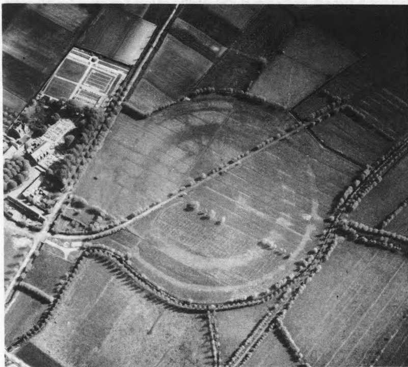
Luchtfoto (met toelating) van de ringwalversterking van Assebroek, die verdedigd werd door 4 grachten, afgewisseld met 3 wallen.

In Veurne 4 kon op die manier de evolutie geschetst worden van de burcht, die gelegen is in de stadskern. We treffen er vooreerst een grote ronde versterking aan, waarvan de littekens nog duidelijk in het stratenpatroon te herkennen zijn : de Noordstraat, de Pannestraat, de Zwarte Nonnenstraat en de Vleeshouwersstraat volgen een cirkelpatroon met een doormeter van ongeveer 240 m, dat start en eindigt bij de Grote Markt. De opgravingen brachten de 15 m brede, maar slechts 1 m diepe gracht van dit rond 890 ontstane kamp aan het licht. Eind 11de - begin 12de eeuw bouwt de graaf, of de burggraaf van de pas kort opgerichte kasselrij, een ringwalversterking.