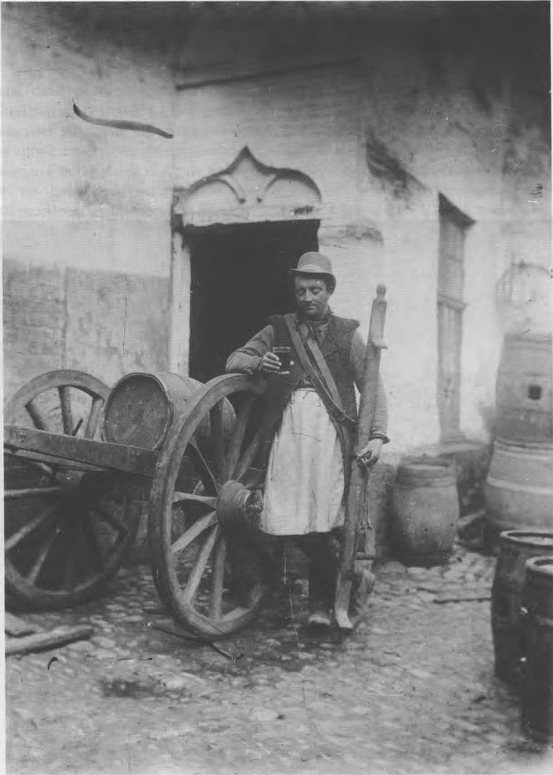
Afb. 2 — Een biervoerder poseert op de binnenkoer van een Brugse brouwerij rond 1900. Hij draagt de traditionele kledij van het officie. Hij houdt een bierboom vast, en leunt op een bierkar.