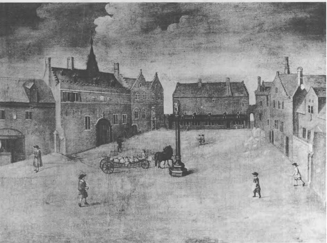
Afb. 1 — Het Huidvettersplein te Brugge, met links het ambachtshuis van de huidvetters, en achteraan het ontvangkantoor van de bierakijnzen. Schilderij tweede helft 17de eeuw (Stedelijke Musea Brugge).