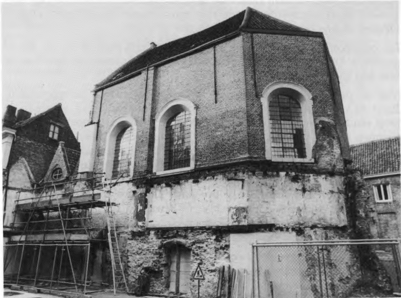
Gezicht op 't Keerske vanuit de Philipstockstraat (foto Jan Vernieuwe).

“Sint Katharina in de Krog” herontdekt. — De grote ouderdom van de Sint-Pieterskapel, ook wel 't Keerske genoemd, in de Philipstockstraat, is ons wel geen geheim. Onlangs kwamen er bij afbraakwerken aan de zuidzijde van het bouwwerk sporen vrij van een zeer vroege bouwfase.