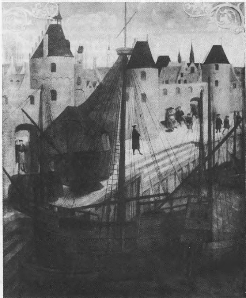
1. de goederenhaven ter hoogte van de Kraanstraat en de Kopingstraat.