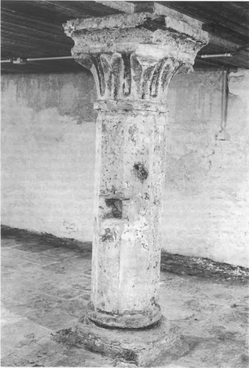
12de-eeuwse zuil met monoliete schacht en bladkapiteel.