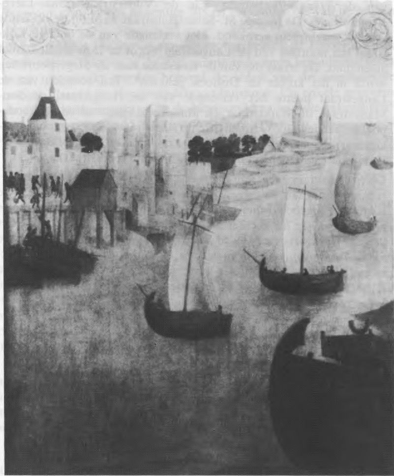
2. de vissershaven ter hoogte van de Kokstraat en meer naar rechts de grote en de kleine vierboete.