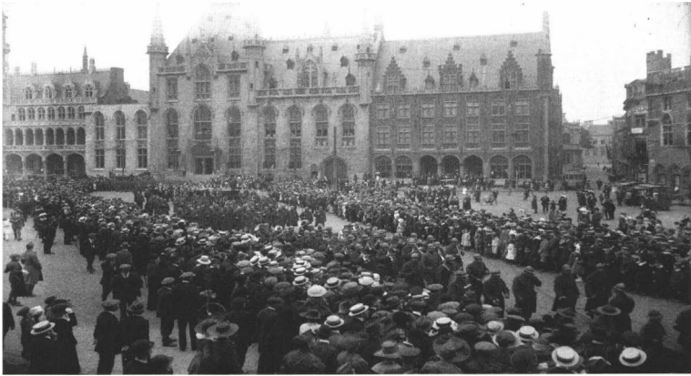
Op 7 juli 1919 werd het stoffelijk overschot van Charles Fryatt met groot eerbetoon en onder ruime belangstelling vanaf het Provinciaal Hof op de Markt te Brugge overgebracht naar Engeland waar hij werd begraven in zijn geboortestad Dovercourt.

vele Belgen; her en der weerklonk zelfs wrokkige taal tegen het Verenigd Koninkrijk. 29 Om die wrok tegen te gaan herinnerden grootse plechtigheden het publiek aan de Brits-Belgische vriendschap. Zo de overdracht van het lichaam van Edith Cavell van Brussel naar Norfolk in mei 1919, een grandioze en tot in de puntjes voorbereide ceremonie die honderduizenden mensen trok. Én de overdracht van het lichaam van Charles Fryatt van Brugge naar Dover en vandaar naar een staatsbegrafenis in Saint Paul's Cathedral .