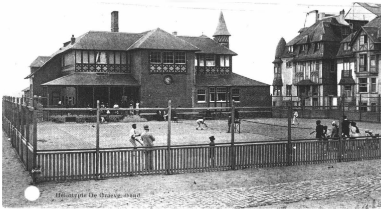
Westende — Le Kursaal.

Tennisterreinen achter het kursaal van Westende op een prentbriefkaart van kort voor de Eerste Wereldoorlog (Verz. Kusthistories, Middelkerke).