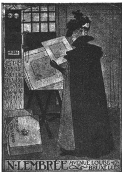
N. B. — Les gravures anciennes sont vendues avec garantie d'authenticité.

ENCADREMENTS ✦ DORURE ET SCULPTURE SUR BOIS ✦ ESTAMPES