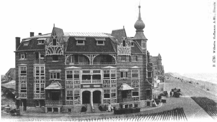
Westende Coin de la Digue