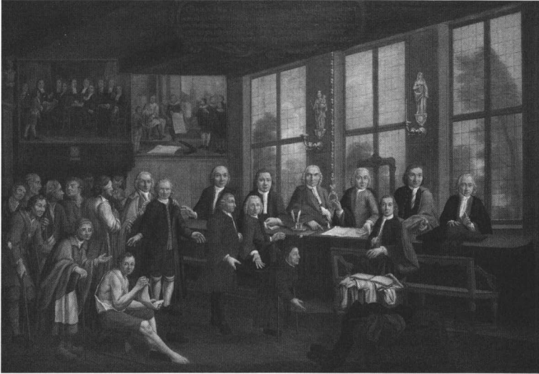
Afb. 1. Pieter Beuckels, Het bestuur van het Brugse kleermakersambacht , 1754, olieverf op doek, 146,7 x 209,5 cm, Musea Brugge - Groeningemuseum, inv. nr. o.1450, Foto: © Lukas - Art in Flanders VZW, Dominique Provost.

Brugse Academie. 45 In Veere, Zeeland, ontwierp en schilderde hij de erepoorten voor de inhuldigingen als markgraaf van de prinsen van Oranje Willem IV in 1751 en Willem V in 1766. 46 Hij was gevestigd in de Eeckhoutstraat te Brugge als kunstschilder en als handelaar in schilderijen. 47