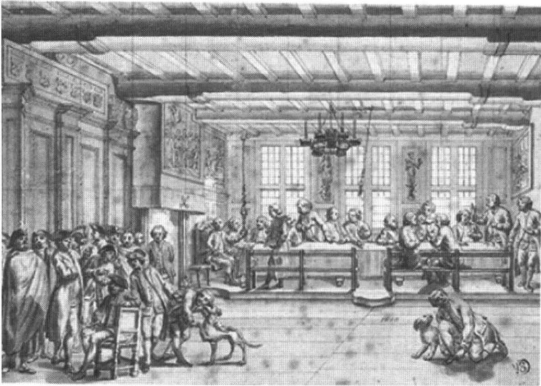
Afb. 2. Anoniem Zuidnederlands / Jan Beerblock?, Bijeenkomst van het kleermakersambacht van Brugge , ca. 1781, pen op papier, 20,2 x 29,3 cm, Musea Brugge Steinmetzkabinet, inv. nr. o.1742, Foto: Musea Brugge.

beschrijving in het resolutieboek van de ontwerptekening van Beerblock komt overeen met wat is afgebeeld op de pentekening Bijeenkomst van het kleermakersambacht van Brugge . 53 De pentekening uit het Steinmetzkabinet van een onbekende kunstenaar is gesitueerd in de oude ambachtskamer. Zoals op Het bestuur van het Brugse kleermakersambacht van Pieter Beuckels zitten de bestuursleden aan de tafel bij het raam. Zij zijn in een geanimeerd gesprek gewikkeld. De deken zit aan het hoofdeinde. Vooraan links wachten de arme mannen. De gelijkenis tussen wat is afgebeeld op Bijeenkomst van het kleermakersambacht van Brugge en de beschrijving in het resolutieboek van de ontwerptekening uit 1781 van Beerblock is opvallend. Op basis van deze archiefbron en