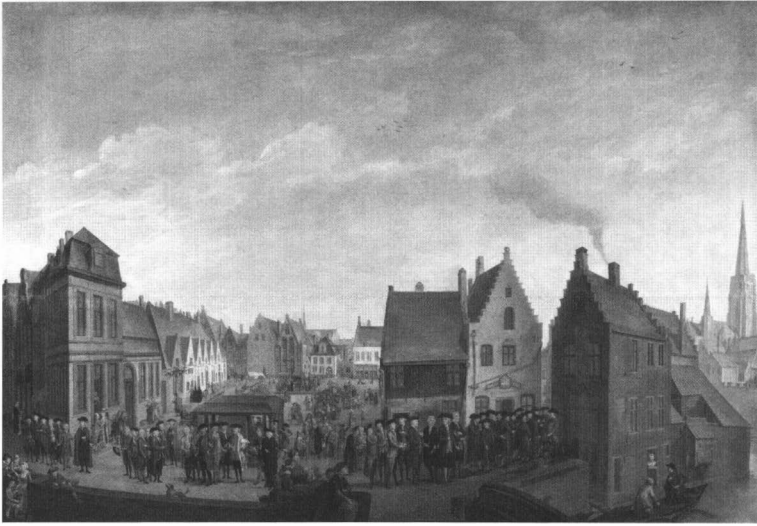
Afb. 4. Jan Beerblock, De Braamberg te Brugge , 1788, olieverf op doek, 300 x 200 cm, Musea Brugge - Groeningemuseum, inv. nr. 0.700, Foto: © Lukas - Art in Flanders VZW, Dominique Provost.

worden tijdens de uitoefening van hun ambt. 56 Zij gaan, samen met de dertien mannen in hun nieuwe kleren, in processie vanuit het ambachtshuis aan de Steenhoudersdijk over de Braamberg, nu Vismarkt, naar de Onze-Lieve-Vrouwekerk om er de zielenmis voor Lodewijk van Gruuthuse en zijn echtgenote bij te wonen. 57 De tekening is een voorstudie van het schilderij De Braamberg te Brugge (afbeelding 4), dat Beerblock op 20 juli 1788 heeft afgewerkt. 58 Wellicht is dit het werk dat hij nauwelijks een week later op 26 juli aan de scheppers heeft gepresenteerd: Eodem wiert op ons ambachs camer overgelevert ter presentie van den heer deken ende eedt ende heeren oude dekens en notabele ge[s]eijt deseniers