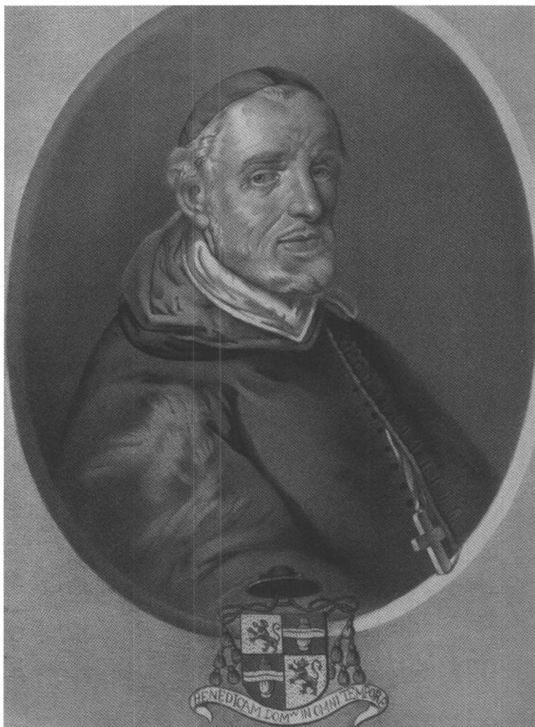
Portret van De Quinckere door J.G. Canneel (F. VAN DE PUTTE, Histoire du diocèse de Bruges , Brugge, 1850, tussengevoegd tussen p. 60 en 61).