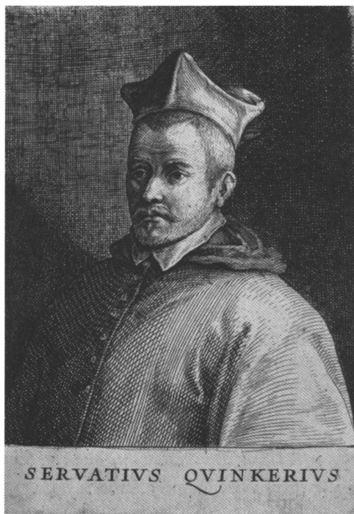
Servaas de Quinckere.

"[Servaas de Quinckere] is... een der minst begrepen en meest raadselachtige figuren gebleven die ooit de bisschoppelijke zetel van Brugge bekleed hebben 2 ."