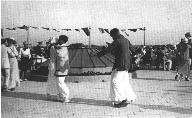
Deze danspartij in openlucht bij het Grand Hôtel Belle-Vue bewijst meteen de verbondenheid onder de toeristische bevolking. Ze gedroeg zich duidelijk als een hechte groep.