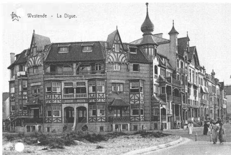
De zeedijkbebouwing op het eerste perceel bij de tennis vlak voor de Eerste Wereldoorlog bood een mooie afwisseling van luxeuze vakantieverblijven.