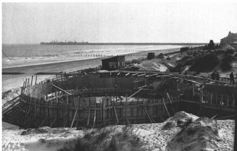
1 August 1942

Een bunker van de Atlantikwall in aanbouw, augustus 1942 (Bundesarchiv Duitsland).