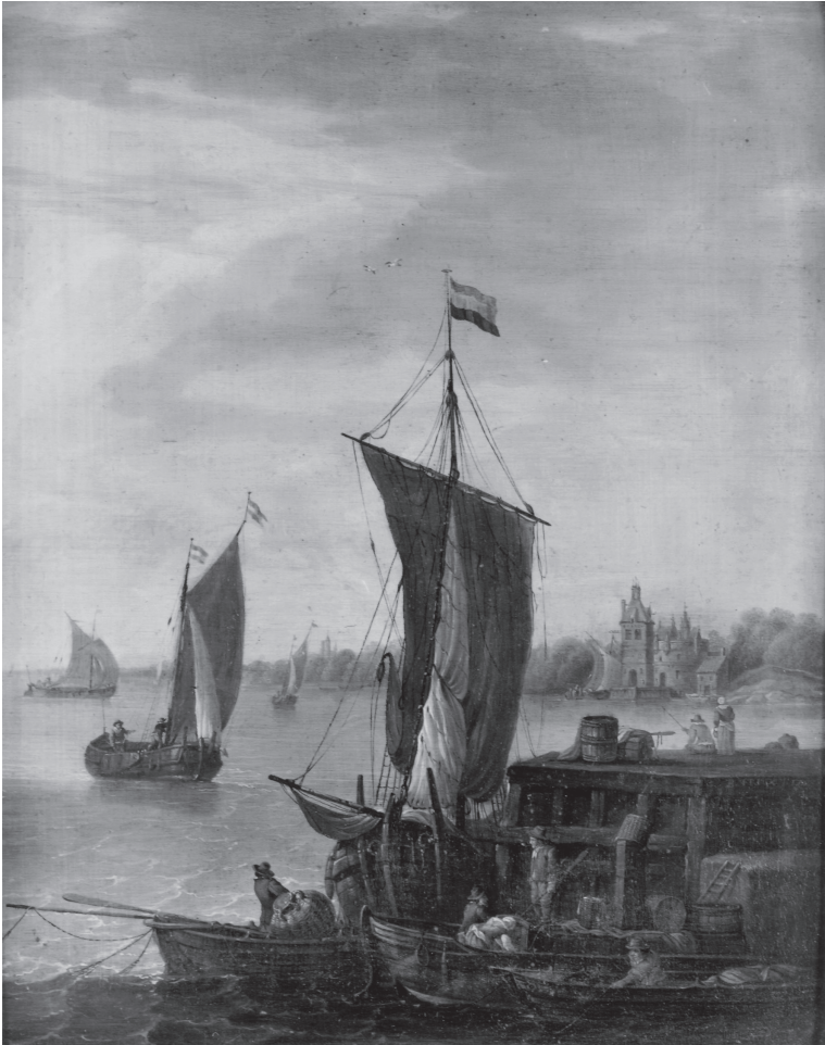
Bernardus Fricx, Rivierlandschap met schepen op een aanlegsteiger , 1790, olieverf op paneel, © RKD-Nederlands Instituut voor Kunstgeschiedenis, Den Haag