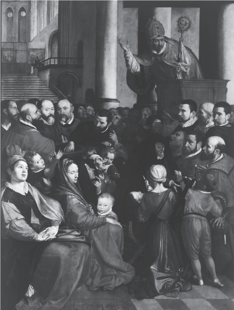
Ambrosius I Francken, De prediking van de H. Eligius en portretten van leden van het Antwerpse smedenambacht , 1588, middenpaneel, olieverf, Antwerpen, Koninklijk Museum voor Schone Kunsten, © Lucas - Art in Flanders vzw