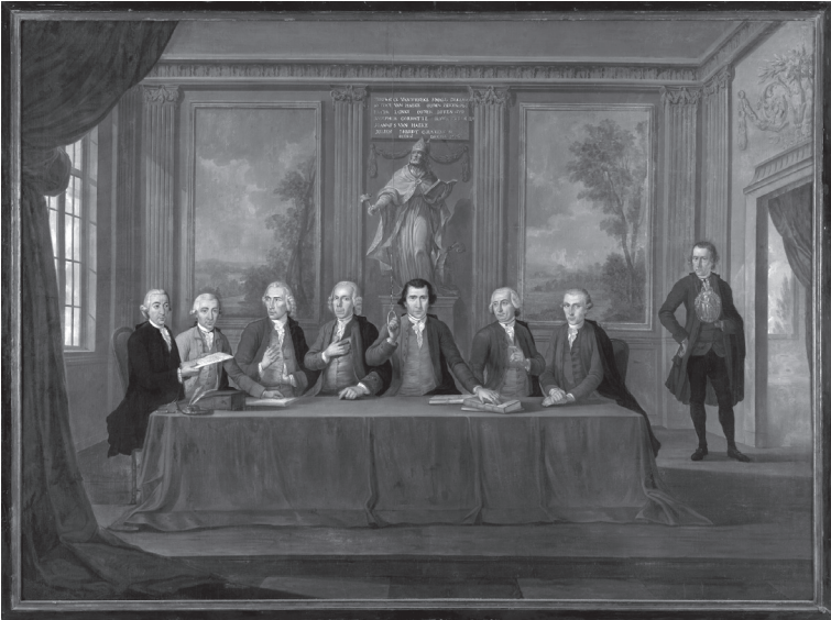
Bernardus Fricx, De Eed van het Brugse smedenambacht , 1783, olieverf op doek, Brugge, Musea Brugge