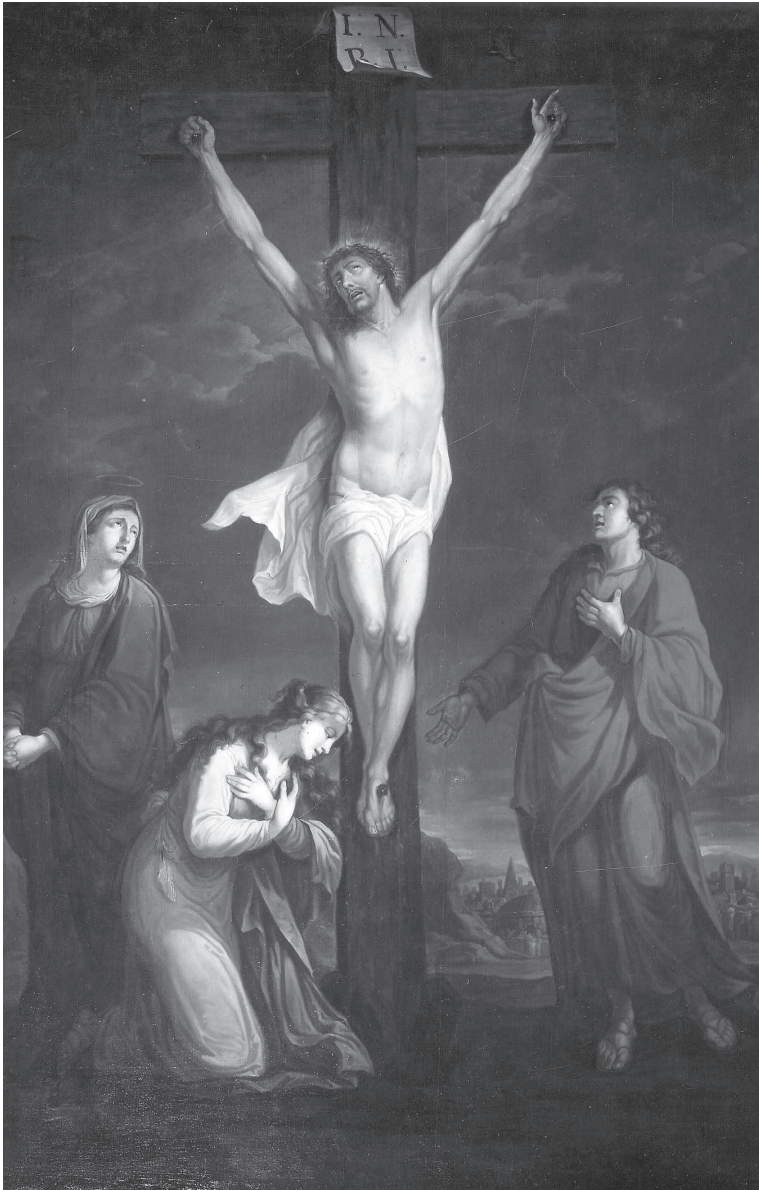
Bernardus Fricx, Kristus aan het kruis , 1780, olieverf op doek, Brugge, Sint-Salvatorskerk, © KIK-IRPA