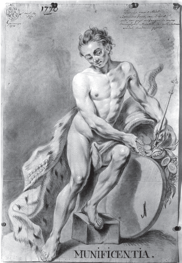
Bernardus Fricx, Munificentia [Vrijgevigheid], 1770, tekening