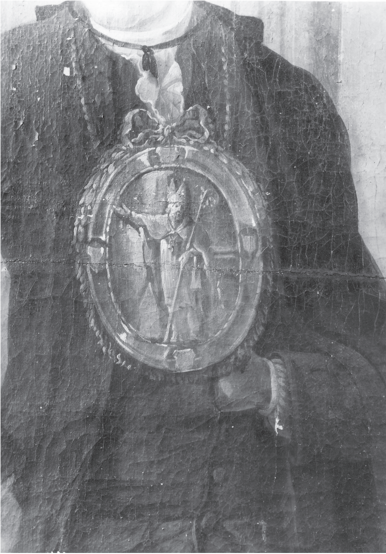
Bernardus Fricx, De Eed van het Brugse smedenambacht , detail, borstschild van de klerk van het ambacht