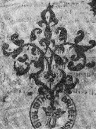
Laatste bladzijde van de Nieuwe lijst van consumptie... , door Jan van Genuwe de jonge in 1581 gedrukt.

Gheprent te Brugghe inde zuucantstrate by my Jan Van Genuwe. 1581.