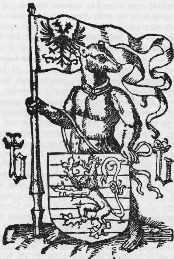
3. Drukkersmerk (II) van Pieter de Clerck.

beide zijden door een gekroonde, gotische letter b geflankeerd (Zie afbeelding III). Hierbij dient opgemerkt dat de drukkersmerken van Pieter de Clerck weinig afwijken van deze door Hubrecht de Croock gebruikt, die