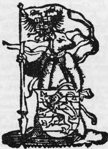
2. Drukkersmerk (I) van Pieter de Clerck.

staande beer, met halsband en de kop naar links gewend, leunende met de linkerpoot op het wapenschild van de stad Brugge, dat vóór het dier op de grond rust. In de rechtervoerpoot houdt de beer een vlaggestok waaraan een wimpel met het wapen van koning Philips II wappert (Zie afbeelding II). Het andere drukkersmerk meet ongeveer 105 mm. hoog bij 70 mm. breed en verschilt in zake voorstelling zeer weinig van het vorige. In de wimpel staat er alleen een dubbele adelaar zonder het eigenlijke wapenschild van de koning. Daarenboven is het geheel langs de