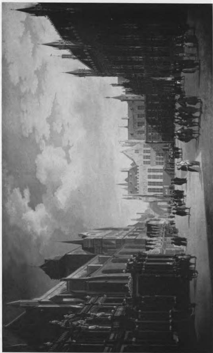
De Burg te Brugge