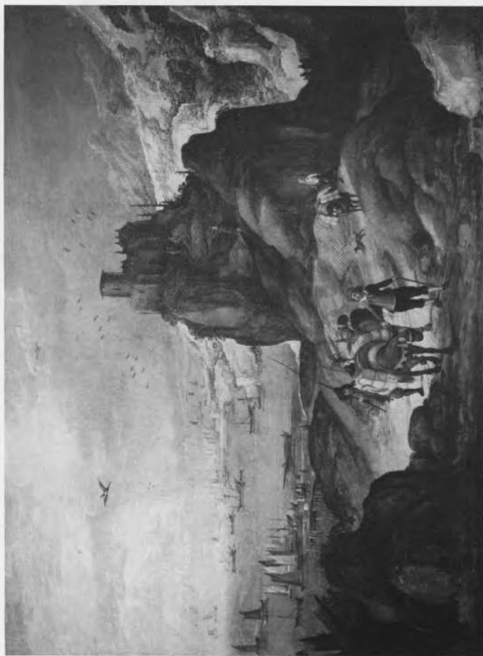
Landschap met de ezeldrijver