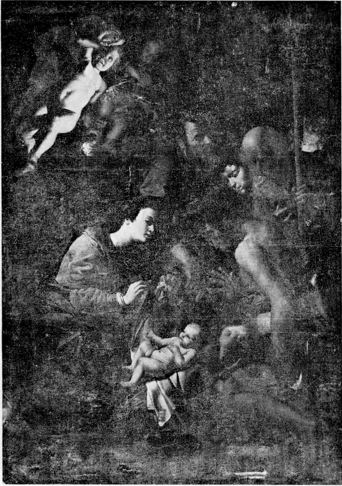
Afb. 2. Th. van Loon : De Aanbidding van de herders. Brussel, Kon. Musea voor Schone Kunsten.