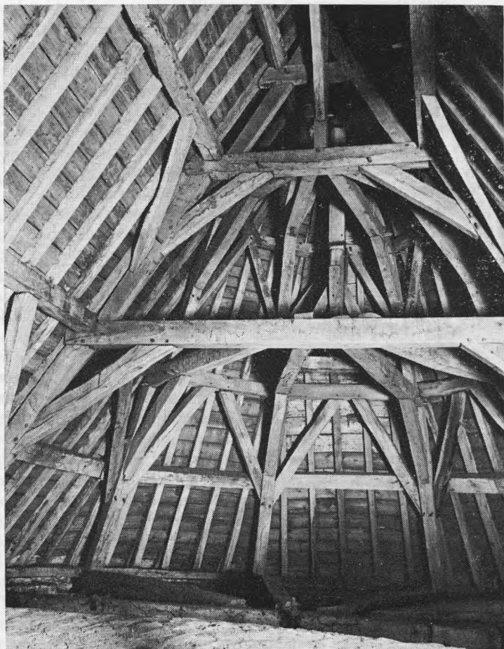
Bekapping boven de koorabsis. Dudzele, kerk van Sint-Pieters-in-de-Banden.