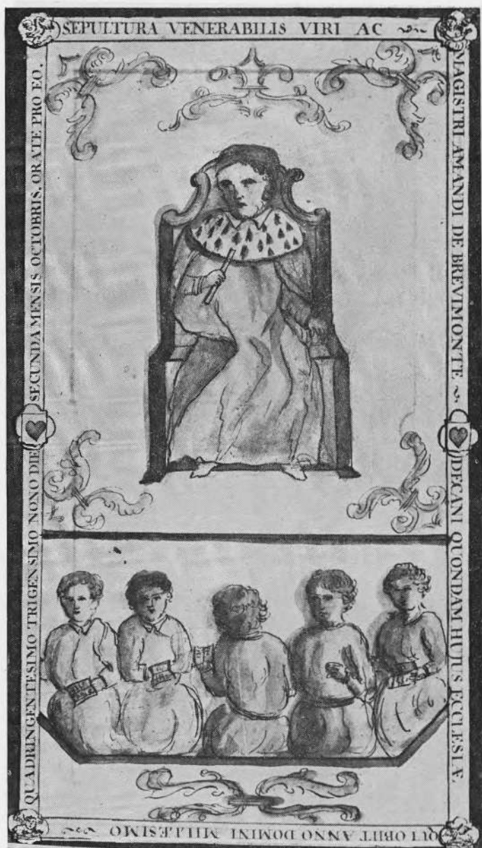
5. Grafplaat van Amand de Brevimonte, 1439.