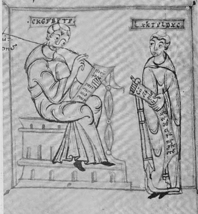
4. Meester en leerling, 12e eeuw.

ne xepiu. qui sine passione dolo. sci possint recor- dari p[er]t[er]re. malae. lxxvii. ratio.