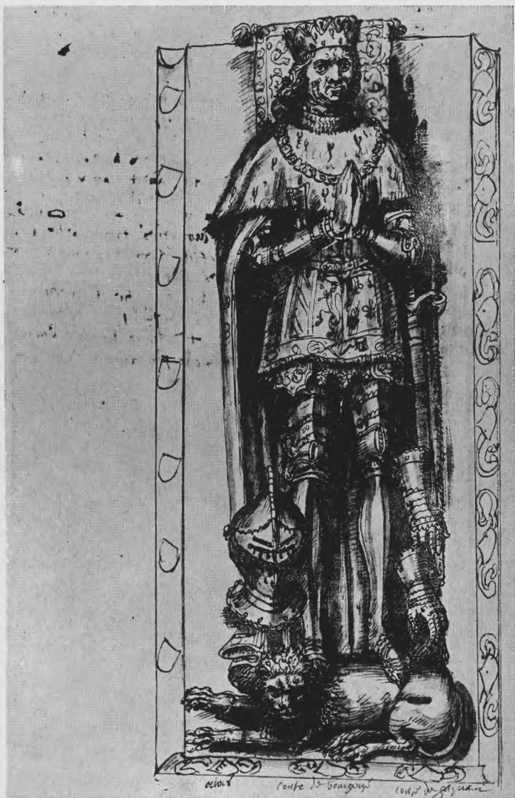
Pl. II. Tombeau de Charles le Téméraire à Bruges. Disposition des armes placées aux pieds du gisant.