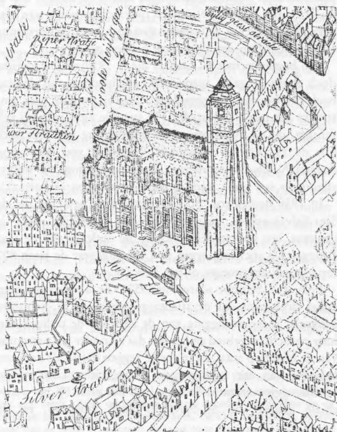
De Sint-Salvatorskerk volgens de kaart van Marcus Gerards (1562)