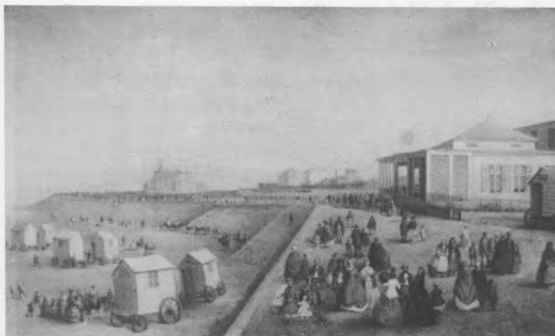
De Zeedijk te Oostende (Catalogus Nr. 35) Oostende - Museum voor Schone Kunsten.