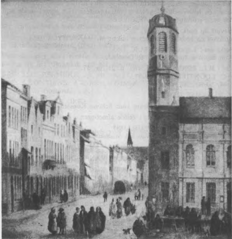
De Kerkstraat te Oostende (Catalogus Nr. 33) Oostende - Museum voor Schone Kunsten.

de Vlaanderenstraat. Rechts de wallen, waarachter het oude stads- gedeelte.