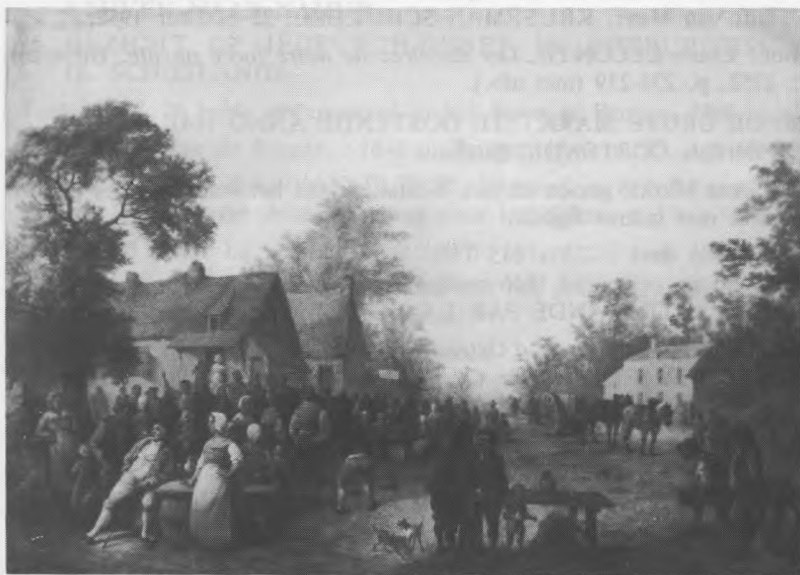
Vlaamse Kermis (Catalogus Nr. 31) Oostende - Museum voor Schone Kunsten.