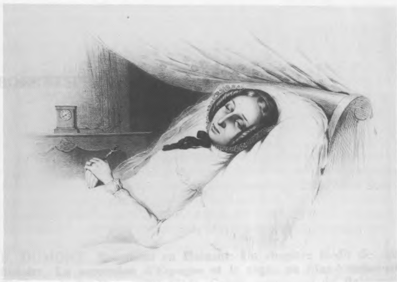
Koningin Louise-Marie op haar sterfbed (Catalogus Lith. Nr. 15).