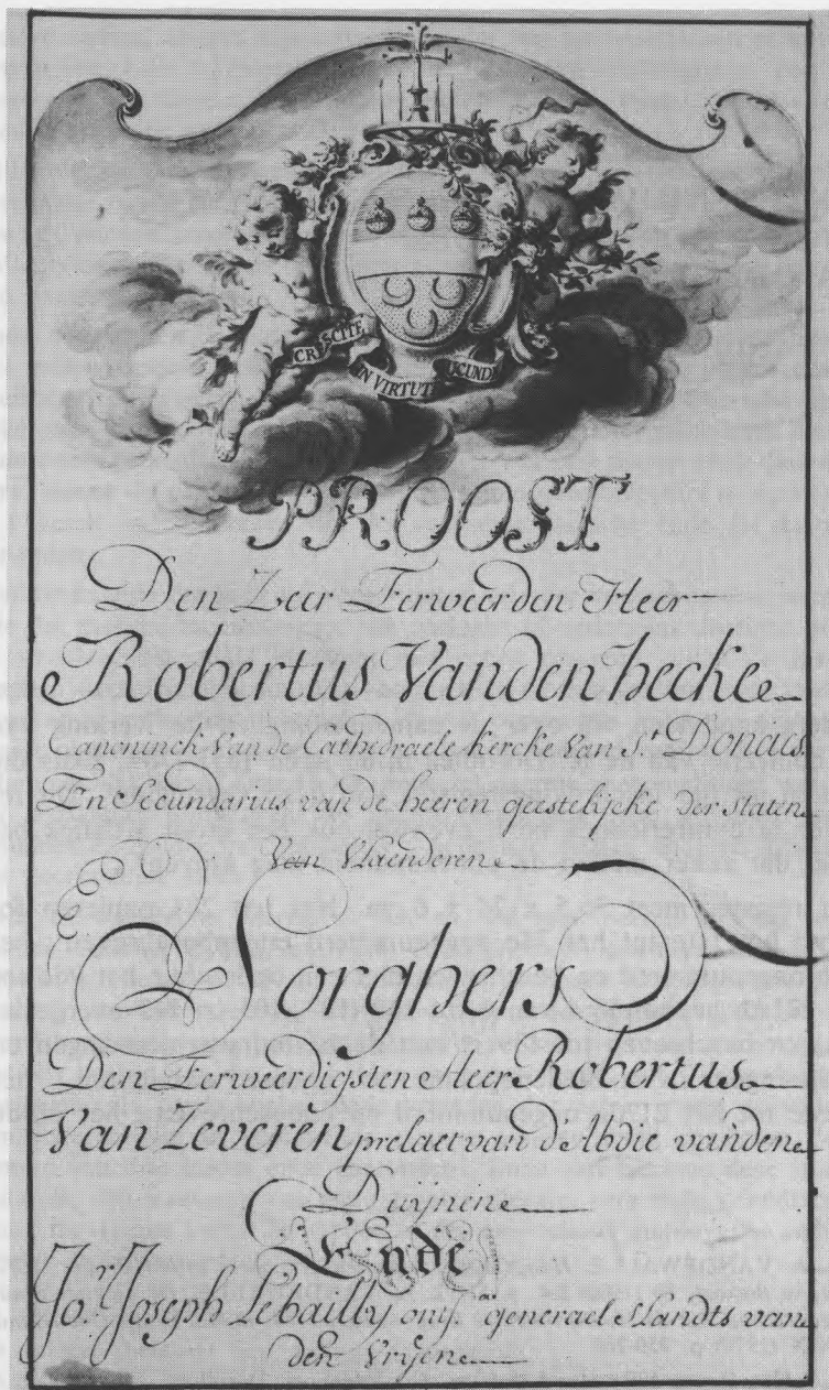
Een recto-blz. uit het confrerieboek, 1759 (f o 115 r o ).