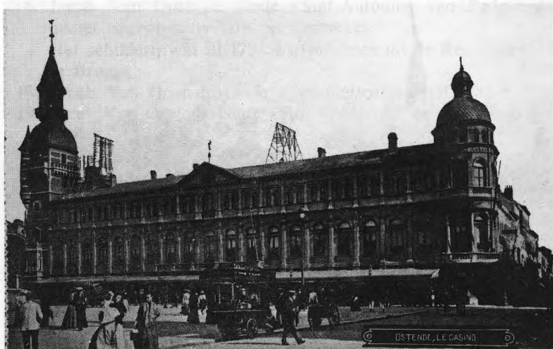
Een gezicht op het Oude Stadhuis (Wapenplein) waarin het Museum gevestigd was.

Het Oostends roerend kunstpatrimonium bedroeg anno 1897 zo'n kleine honderd nummers. Naargelang hun herkomst waren deze werken (hoofdzakelijk schilderijen) in enkele categorieën te groeperen.