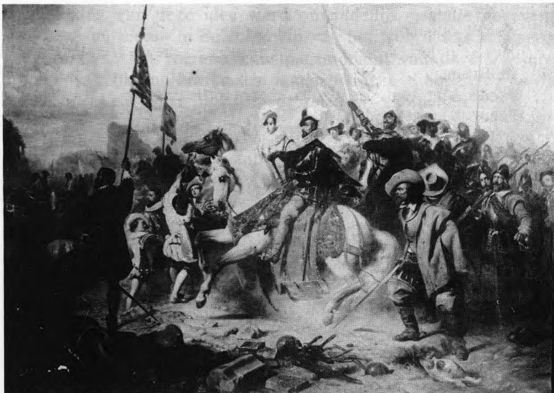
Edouard Hamman, Intocht van Albrecht & Isabella. (Foto uit Permeke's Catalogus).

bestuur op 5 april 1805 (15 Germinal XIII) het besluit de werken ter beschikking te stellen van de Sint-Pieterskerk. Eén der zeven, bijbelse personages in aanbidding voor het H. Sacrament voorstellend, werd eigendom van de Kerkfabriek ter compensatie van Gaspard De Crayer's «Wonderbare Visvangst» die anno 1795 van het hoofdaltaar was weggenomen. De andere zes werden enkel in bruikleen afgestaan. In september 1895 besliste het Schepencollege deze schilderijen op te vragen voor het museum 3 . In oktober werden ze naar het Kursaal overgebracht om er hersteld te worden, want ze verkeerden in een deplorabele toestand. Henri Permeke voltooide de restauraties op 15 juni 1897.