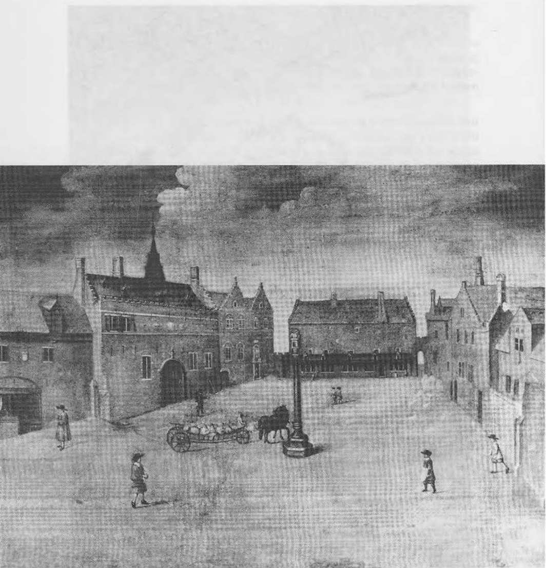
Afb. 1 — Het Huidevettersplein te Brugge, met links het ambachtshuis van de huidvetters, en achteraan het ontvangkantoor van de bierakijnzen. Schilderij tweede helft 17de eeuw (Stedelijke Musea Brugge).