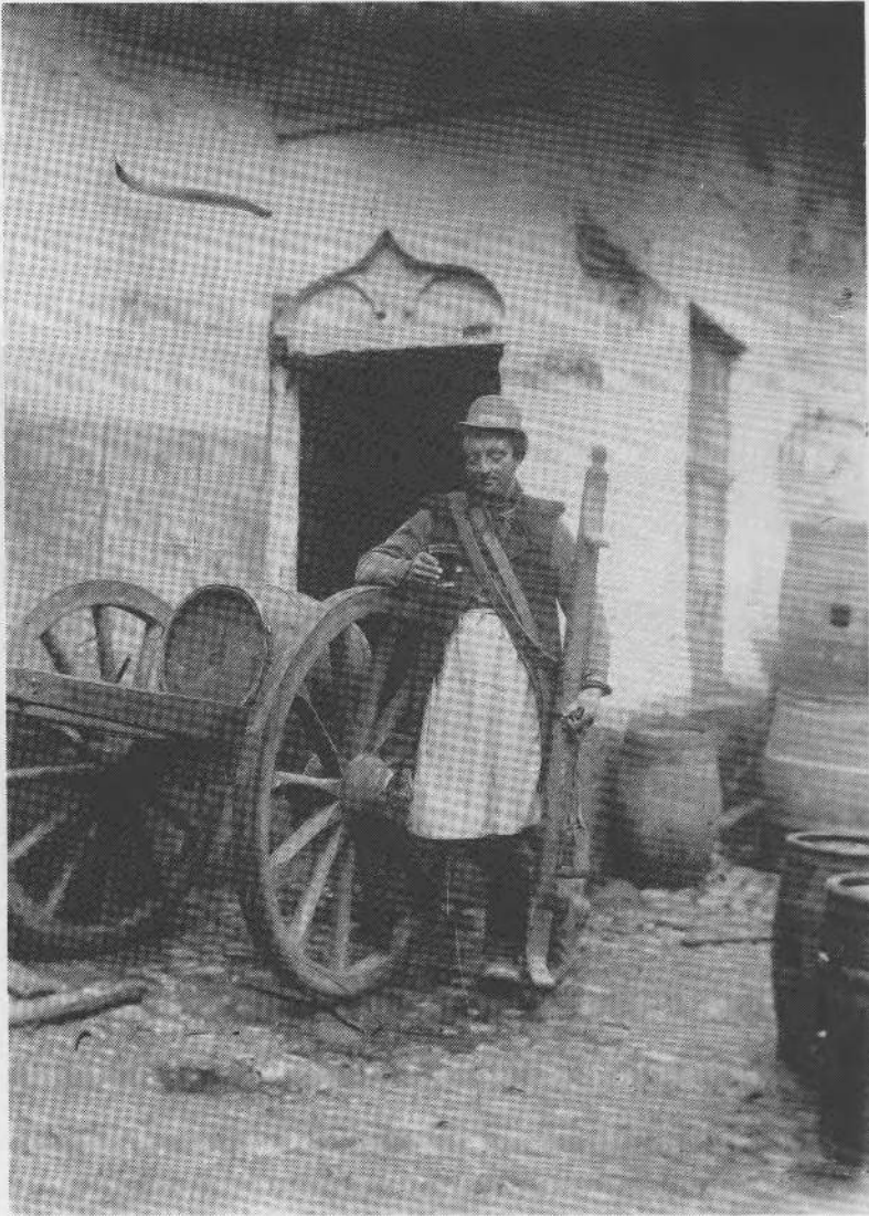
Afb. 2 — Een biervoerder poseert op de binnenkoer van een Brugse brouwerij rond 1900. Hij draagt de traditionele kledij van het officie. Hij houdt een bierboom vast, en leunt op een bierkar.