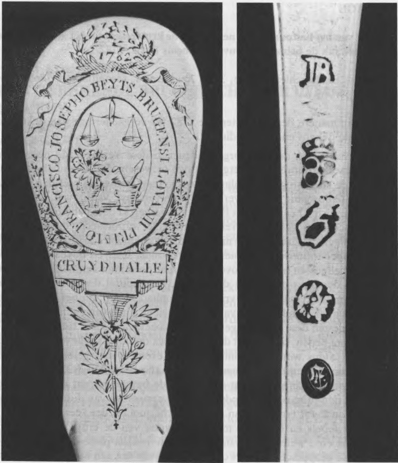
Afb. 2. Opschrift en merken op de achterzijde.

1 De beschrijving van het Elmschillen 63. 000 Brugge.