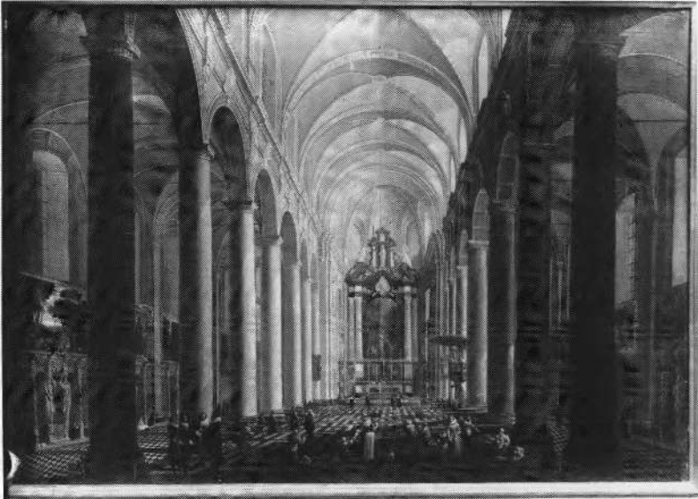
1. Anoniem zeventiende-eeuws schilderij met ' Binnenzicht in de Sint-Walburgakerk ' te Brugge. Bemerkt vooral de opstelling van de biechtstoelen in de zijbeuken. (Kopenhagen, Statens Museum for Kunst)

Een figuur die in die summiere opsomming ontbreekt, is Arnout Pluvier 5 . Aan deze kunstenaar werd tot nu toe heel weinig aandacht besteed. Nochtans blijkt uit enkele recent gevonden archiefteksten dat hij verscheidene gewrochten tot stand bracht. Biografische gegevens over deze beeldsnijder schenen niet te bestaan, doch ook op dit gebied brachten een aantal onlangs opgedoken documenten nieuwe inlichtingen. Armand de Behault de Dornon publiceerde in zijn standaardwerk 6 i.v.m. het verblijf van Engelse koningen te Brugge, een hele reeks Pluviers, maar kon uiteindelijk geen familieverband met de door ons bestudeerde naamgenoot aanwijzen.