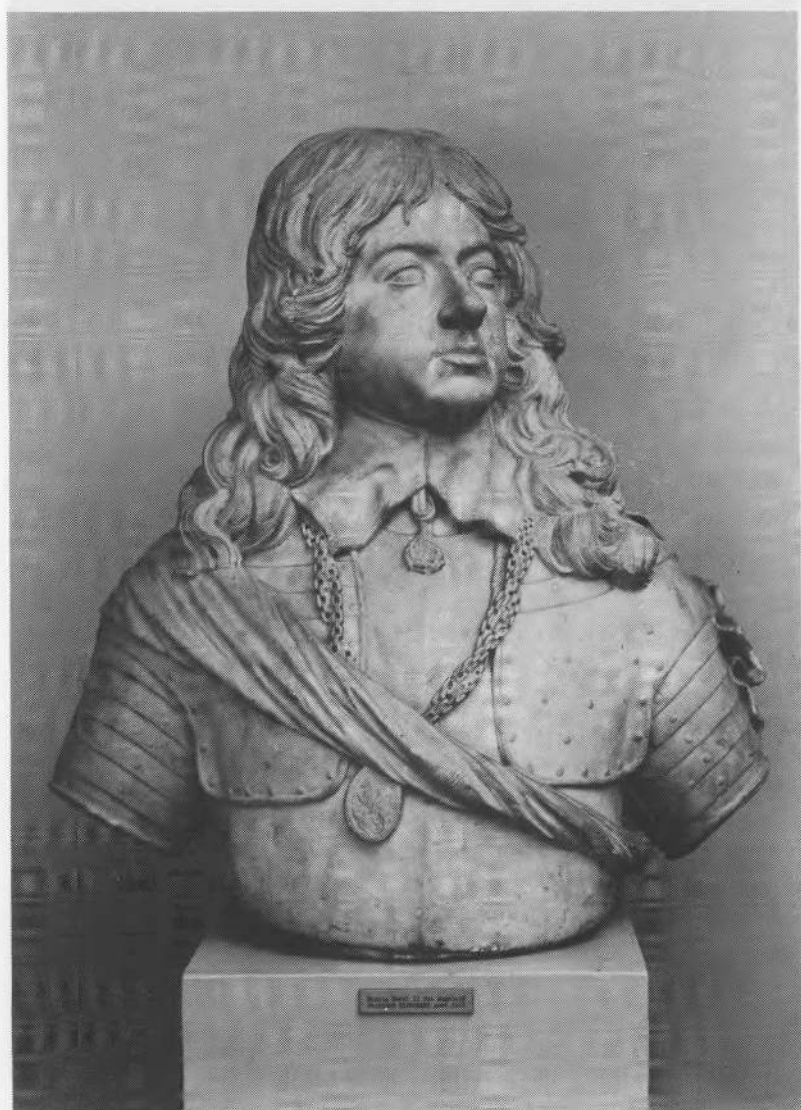
4. Beeld van Karel II in het Rijksmuseum te Amsterdam. Het zeventiende-eeuws kunstwerk werd gekapt door F. Dieussart.