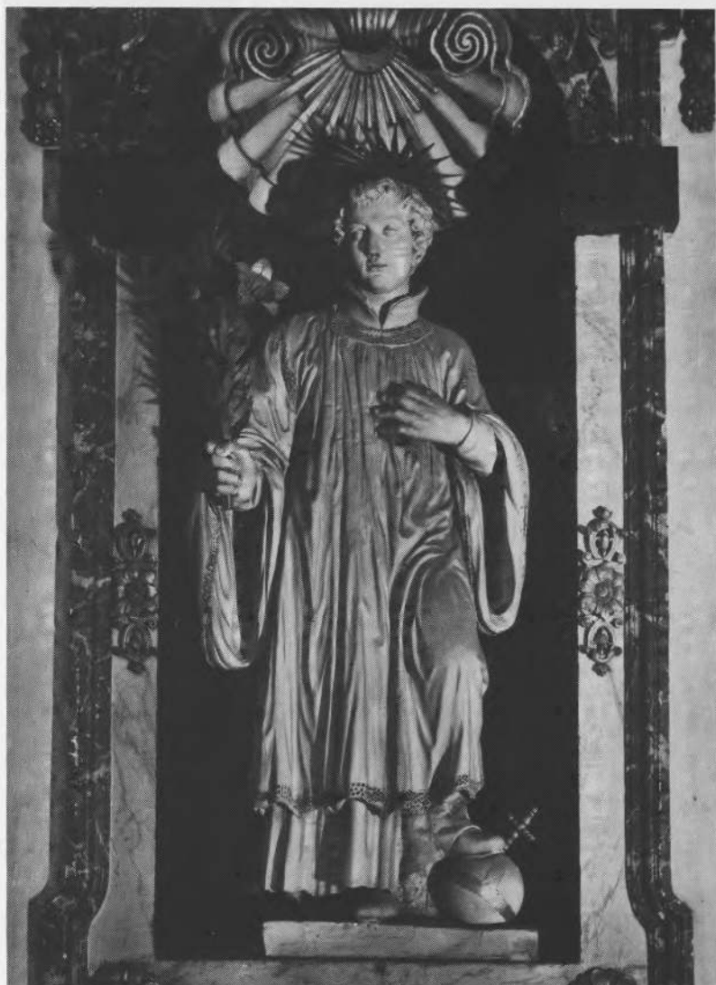
5. Zeventiende-eeuws beeld van de H. Aloysius van Gonzaga in de voormalige jezuïetenkerk te Brugge. De foto werd genomen vóór de recente restauratie (1978-1980).