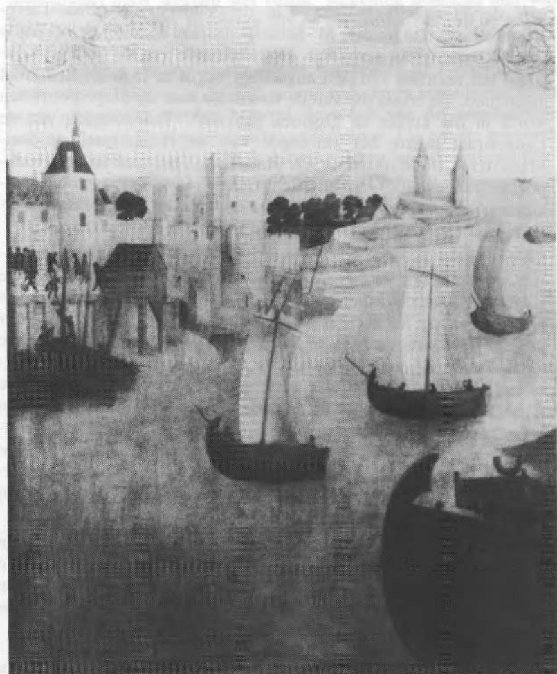
2. de vissershaven ter hoogte van de Kokstraat en meer naar rechts de grote en de kleine vierboete.