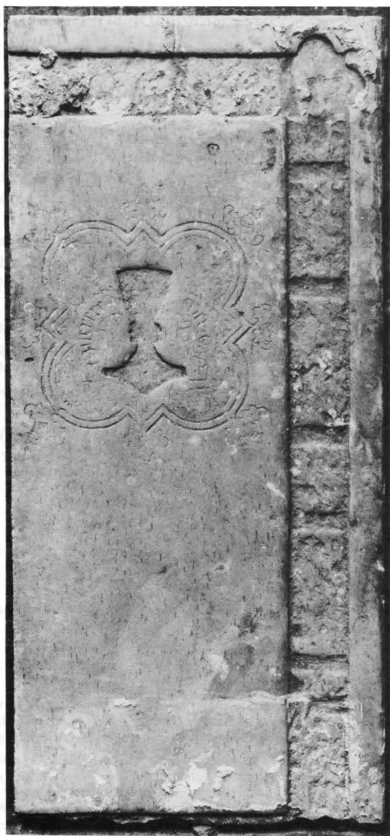
Afb. 1 — Grafzerk van een onbekende priester.