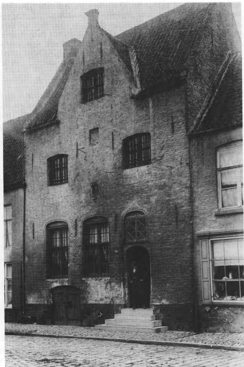
De voormalige gevangenis van Nieuwpoort.