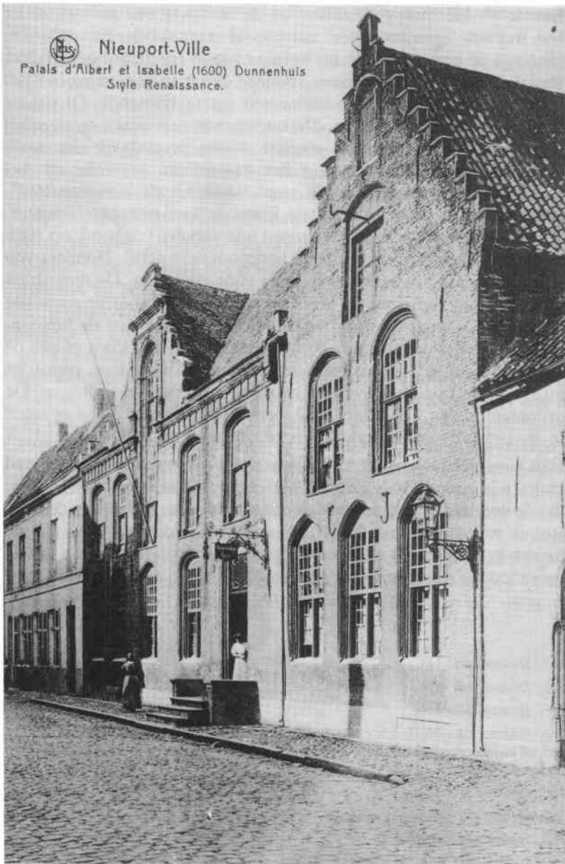
Het refugehuis van de Duinenabdij.