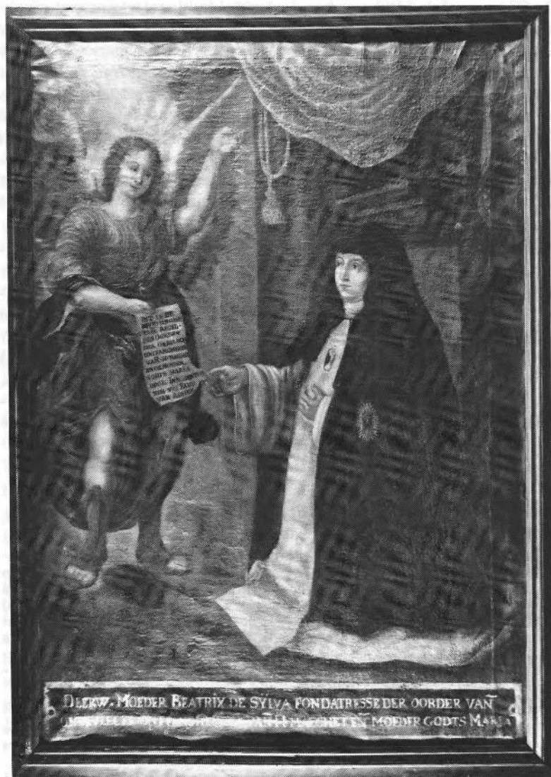
Afbeelding 3 : de zalige Beatrix de Silva, schilderij van het OCMW, niet gesig-neerd, 17de eeuw (151,5 x 108,5 cm) nr O.S 175.I. Het geschilderd onderschrift luidt DEERW. MOEDER BEATRIX DE SYLVA FONDATRESSE DER OORDER VANDE ONBEVLEECTE ONTFANGHENISSE VANDE H.MAEGHET ENDE MOEDER GODTS MARIA.