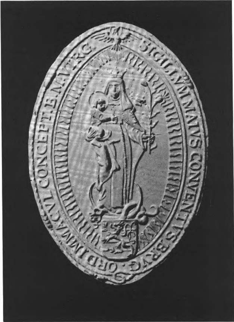
Afbeelding 2: vergroting van het zegel van de Brugse conceptionisten SIGILLUM MAIUS CONVENTUS BRUGENSIS ORDINIS IMMACULATAE CONCEPTIONIS BEATAE MARIAE VIRGINIS. De duif in de bovenhoek en de gekroonde leeuw op het voetstuk wijzen op het Heilige-Geesthuis en op de stad Brugge. Plaasteren afgietsel van de bewaarde zegelmatrijs. Zie n. 21.