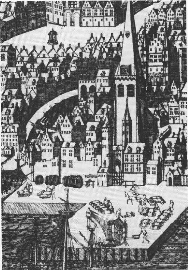
Afb. 7. Het draaien van de kraan aan de staart door een kraankind. Detail van een anoniem gezicht op Antwerpen, ca. 1532. Amsterdam, Rijksmuseum-Stichting OB 4318.