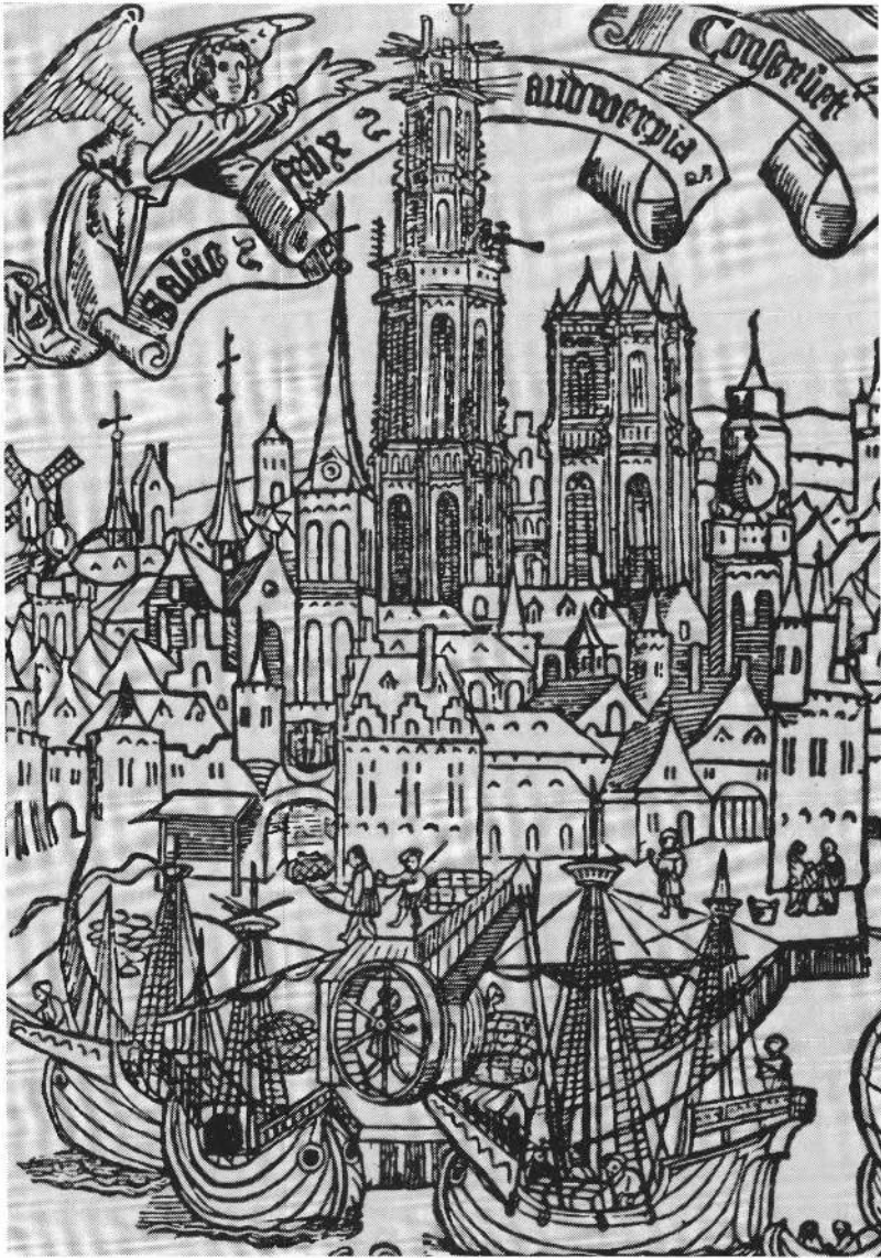
Afb. 8. De draaibare havenkraan te Antwerpen in werking, 1515. Anoniem meester. Redegezicht. Houtsnede (in : Benedictus de Opijts, Loeflicken Sanck , Antwerpen, Jan de Gheet, 1515).