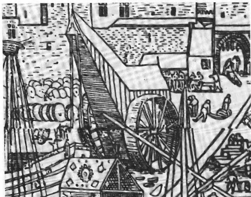
Afb. 6. De draaibare houten havenkraan te Antwerpen, 1515. Anoniem meester. Redegezicht. Houtsnede getiteld "Antverpia Mercatorum Emporium", detail. Stad Antwerpen, Museum Plantin-Moretus en Prentenkabinet. Verzameling Stedelijk Prentenkabinet, cat. nr. VI/ON. Copyright.

meester van tymmeringhen", last "een ander hout daer toe te zoekene, dat orborlec ware eenen standaert af te makene". Genoemde timmerman en zijn gezellen vonden en kochten een geschikte boom in het dorp Rijmenam. Na het "overhout" afgehouden te hebben, werd de stam daar "verslaghen" en gevierkant. De aldus verkregen ruwe standerd samen met het "fasseelhout" van de takkebossen werd per vaartuig naar Antwerpen gevoerd en daar op de Werf gelost door de "craanmeesters" en "haren gheselschapen" met behulp van de toen nog steeds werkende kraan. Vervolgens werkten de meester timmerman en zes van zijn gezellen tot 32 of meer dagen aan het ineensteken van het nieuwe onderstel met zijn toebehoorten, namelijk twee "platen", twee "aensaten", vier "afsaten", vier "grote houte ten satele" of "satelhouten" en andere stukken hout dienende voor de zetel. Het plaatsen van het nieuwe onderstel, bestaande uit zetel en standerd, was niet eenvoudig. De kraan moest door middel van