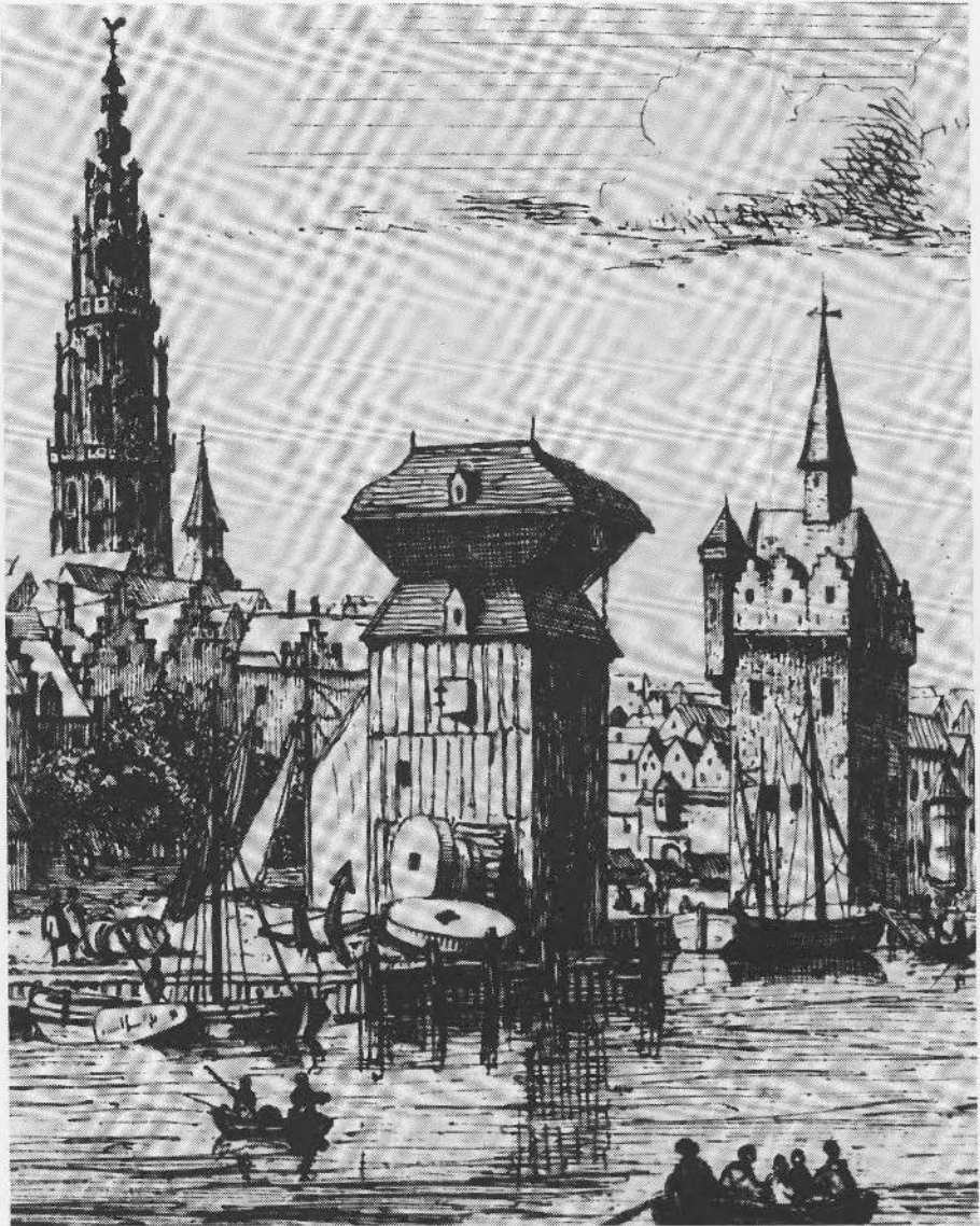
Afb. 9. De dubbele niet draaibare havenkraan met gesloten kraanhuis te Antwerpen in 1644. Het toestel werd in 1548 opgericht en in 1811 afgebroken. Ets gemaakt door J. Linnig (19de eeuw), naar een schilderij van Bonaventura Peeters. Detail. Stad Antwerpen, Museum Plantin-Moretus en Prentenkabinet. Verzameling Stedelijk Prentenkabinet, cat. nr. M II/L. 366-368.