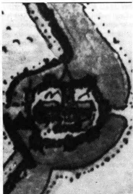
Afb. 2. Het kasteel van Nieuwpoort omstreeks 1560. Vergroot detail uit de kaart van Nieuwpoort van Jacob van Deventer. De voormalige Sint-Laurentiuskerk, toen nog bestaande uit de hoge oude kerktoeren tussen de twee beuken, is duidelijk te zien.