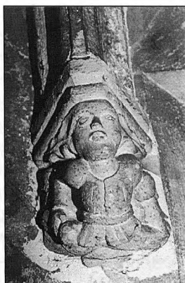
Kraagsteen in de eerste torenverdieping van de Poortersloge, ca. 1400.

Dit brengt ons helaas opnieuw bij de hamvraag wanneer de stad Brugge in het bezit kwam van de grond(en) naast de Sint-Jansbrug en de erop berustende renten voor haar rekening nam. En wanneer dan, en in wiens opdracht met de bouw van de Poortersloge werd begonnen. Het blijft alvast een teleurstellende aanwijzing dat zelfs Gilliodts die zo geduldig naar dergelijke informatie in de Brugse stadsrekeningen en -oorkonden zocht geen spoor van een stedelijk initiatief inzake de Loge terugvond. Van onze zijde moeten we eveneens vaststellen dat een onderzoek van de oorkondenverzamelingen en de renteboeken bewaard op het Rijksarchief te Brugge evenmin het antwoord dichterbij brachten. We stellen derhalve onze hoop nog op een zoektocht naar de betrokken rente(n) in de Brugse stadsrekeningen.