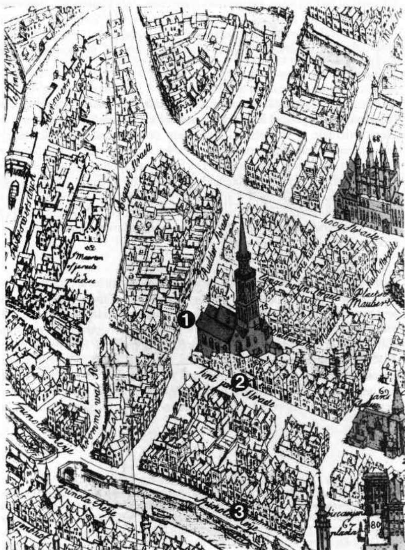
Le quartier des Portugais à Bruges, détail de la carte de Marcus Gerards, 1562. Légende : 1. Maison de la nation portugaise, 1494; 2. La maison "Poorteghale", 1496; 3. La maison "den Schilt van Portugael", 1665.