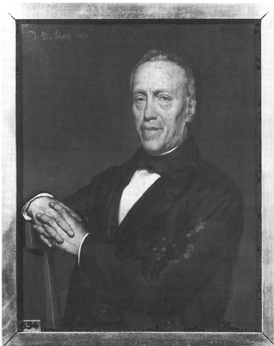
8. Henri Julien (?) De Stoop, Portret van een man , 1860, olieverf op doek, 40 x 32 cm. Brugge, Groeningemuseum, inv. 0.634.