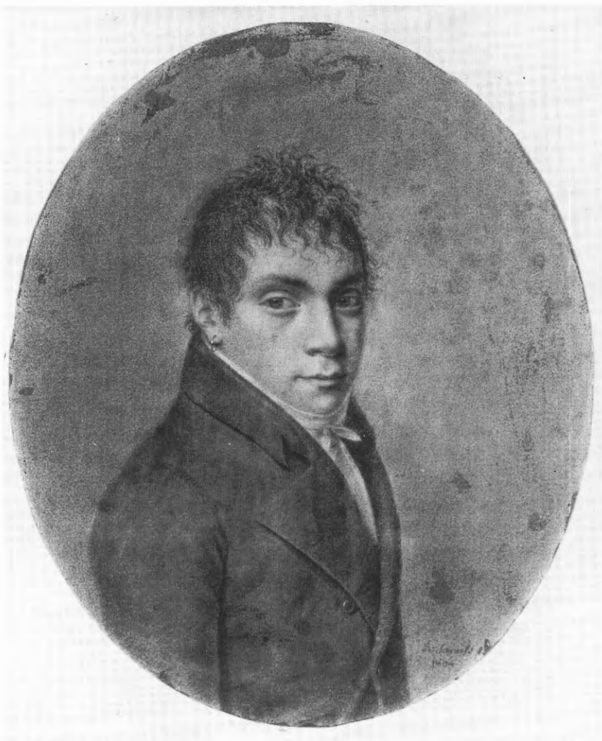
2. Rochus Serneels, Portret van een man , 1804, tekening op papier, 220 x 185 mm. Brugge, Steinmetzkabinet, inv. 0.1517.