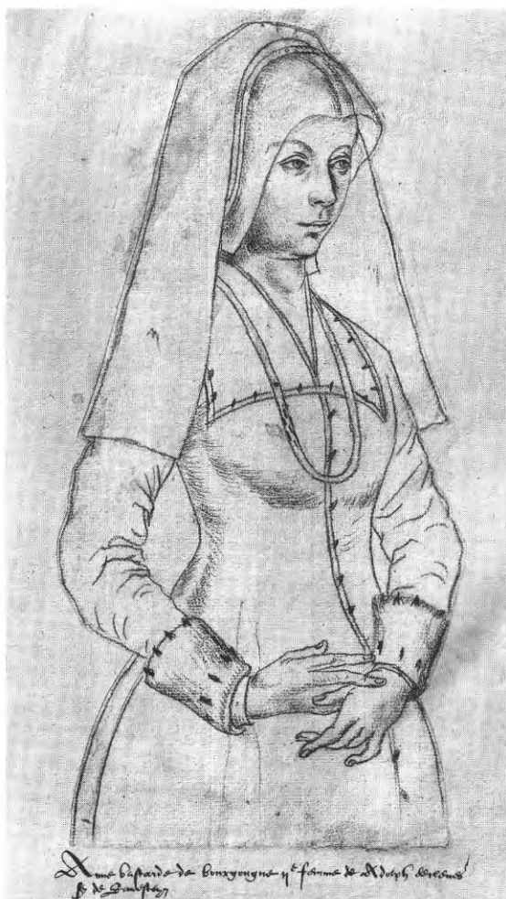
8 Portret van Anna van Bourgondië (Receuil d'Arras).

werd er begraven 28 . Op 21 juni 1470 trad Adolf voor de tweede maal in het huwelijk met Anna, de natuurlijke dochter van Filips de Goede (zie afb. 8). Hij werd luitenant-generaal van de Nederlanden van 1474 tot 1481, wat na de dood van Karel de Stoute (+1477) een zware verantwoordelijkheid inhield. Hij regeerde hierbij in overleg met de kanselier en de leden van de Grote Raad. Hij was voogd van