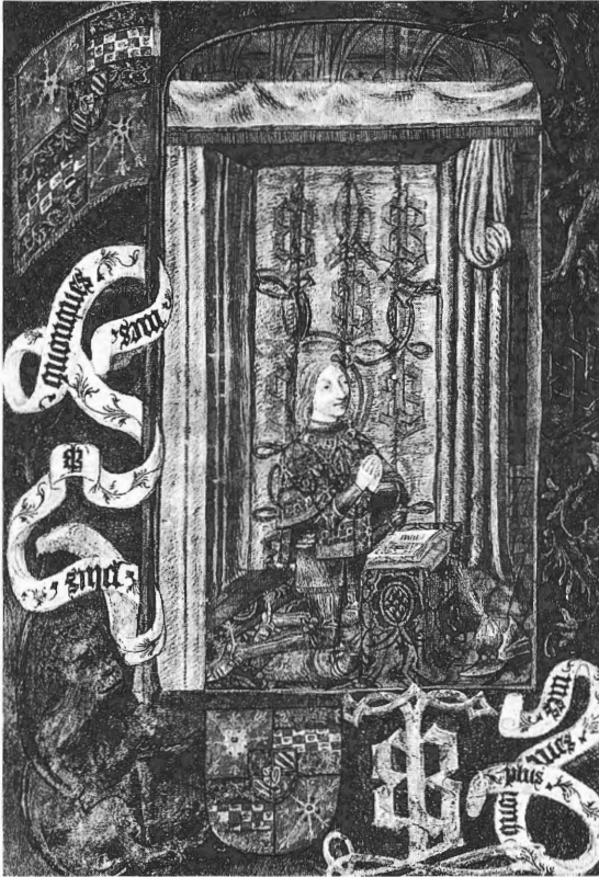
6 Miniatuur uit het getijdenboek van Adolf van Kleef.

eerste echtgenote Beatrijs van Portugal-Coimbra pleegde daarop een antwoord te zijn (Adolf: “PLUS ONCQUES”) “MAIS ONCQUES MIEUX” (in modern Frans uitgedrukt “Plus que jamais mien, mais jamais mieux”) 19 . Twee miniaturen van zijn getijdenboek bewaard in