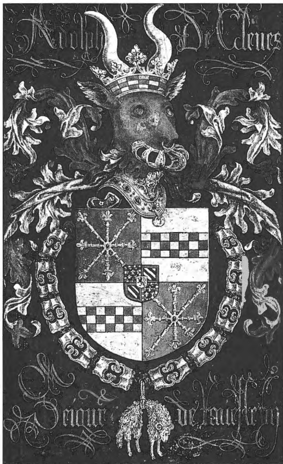
2 Gulden Vlies- wapenbord van Adolf van Kleef in de St.-Salvatorskathedraal te Brugge.

van keel met de binnenkant van goud. Dit wapenschild wordt aange- troffen in handschriften en op de wapenborden van Adolf van Kleef vervaardigd naar aanleiding van de kapitels van de orde van het Gulden Vlies 8 (zie afb.2). Dit ordeteken is dan ook vaak afgebeeld onder zijn wapenschild. Enkel Adolf genoot het voorrecht tot deze ridderorde te behoren, zijn zoon Filips niet. Het wapenschild op de fundatieplaat komt volledig met het beschreven wapenschild overeen.