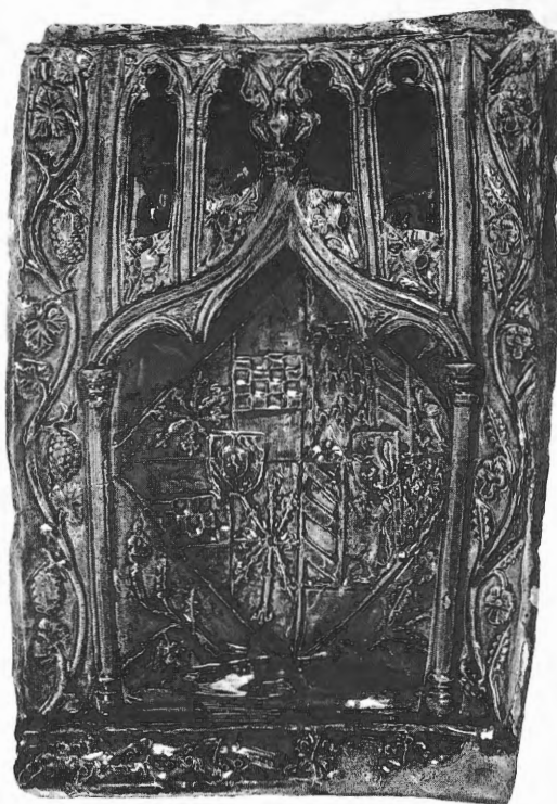
3 Kacheloventegel met de wapenschilden van Adolf van Kleef en van Anna van Bourgondië opgegraven te West-Souburg.