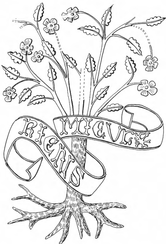
5 Reconstructie-tekening van een kacheloventegel met de lijfspreuk van Anna van Bourgondië.

Adolf is wel genoeg bekend en luidde “PLUS QU’ONCQUES (MES)” zoals trouwens ook wordt afgebeeld op twee miniaturen uit zijn getijdenboek, op glasramen en op penningen 17 (zie afb.6). De kenspreuk van Adolf werd in het Oud-Nederlands vertaald als “Meer dan ooit de mijne” en in het Latijn “Plus quoque” 18 . Het devies van zijn