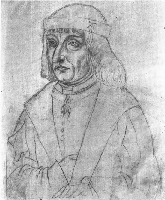
7 Portret van Adolf van Kleef (Receuil d'Arras,).

matie 24 . Hij huwde op 6 mei 1453 Beatrijs van Portugal–Coimbra (+1462), de nicht van hertogin Isabella van Portugal (+1471). Hertogin Isabella speelde trouwens een beslissende rol in dit huwelijk. Zij voerde niet enkel de besprekingen hieromtrent maar zorgde ook voor een belangrijk deel van de bruidschat 25 . Beatrijs schonk hem een zoon genaamd Filips die geschiedenis zou maken 26 alsook Louise een dochter die vroegtijdig stierf en te Turnhout begraven werd 27 . Volgens Olivier de la Marche voerde Adolf in 1454 de wapenpas te Rijsel aan onder de naam van “de ridder met de zwaan” tijdens de feestelijkheden aldaar waarbij Filips de Goede de beroemde Eed van de Pauw uitsprak. Adolf werd in 1456, tijdens het negende kapittel in Den Haag tot ridder van de Orde van het Gulden Vlies verkozen. Beatrijs stierf op 25 februari 1462 in Le Quesnoy (Fr.) en