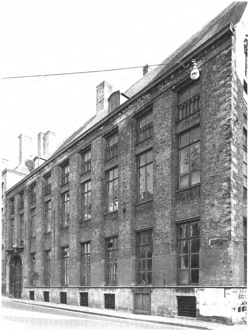
Het middeleeuwse huis "Casselberg" in Brugge, langsgevel.