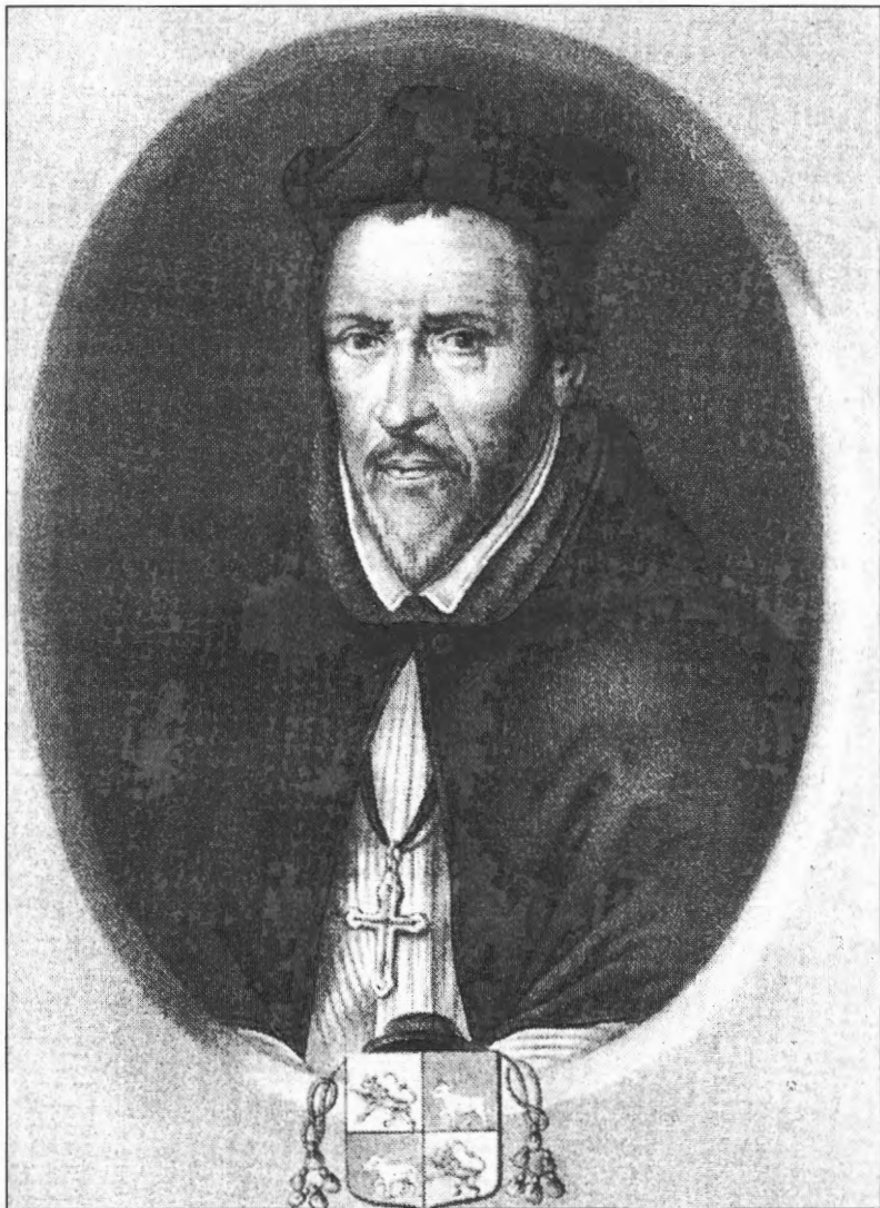
Portret van bisschop Mathias Lambrecht Lithografie naar geschilderd portret, 19 de eeuw