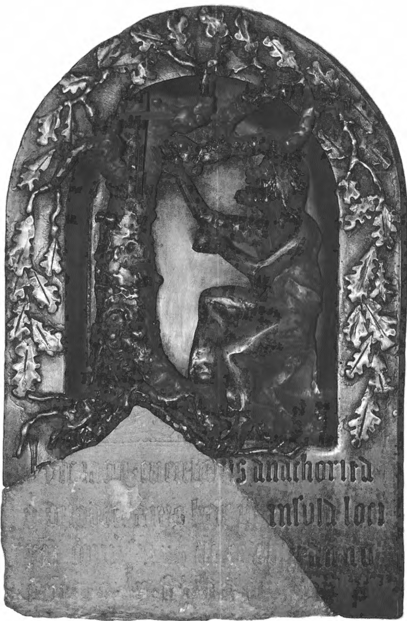
Fragment van de funeraire gedenksteen van Everelmus (begin 15 de eeuw), in 1989 geplaatst in een messingbeeldhouwwerk van Jef Claerhout (Brugge, Abdij Sint-Trudo).