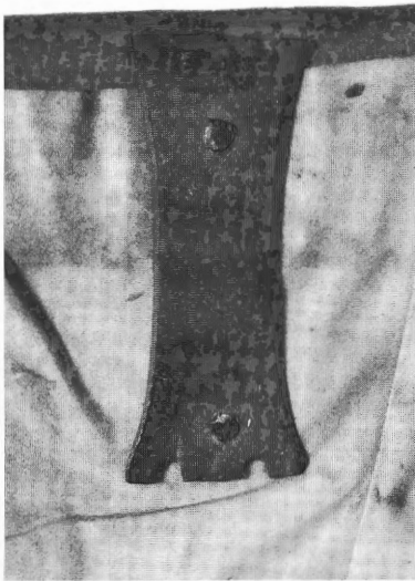
Fig. 4. Kettingklamp van de Duinenabdij zonder wapen (OB 158)

De ketting ( catena ), waarmee de codices aan hun lessenaar bevestigd waren, is in geen enkel geval bewaard gebleven. Wel zijn enkele van de messing kettingklampen, die de verbinding vormden tussen ketting en band, min of meer intact tot ons gekomen. We vermeldden reeds de met een wapen gemerkte helften, die naar alle waarschijnlijkheid in principe aan de buitenkant van de band waren aangebracht 27 . Van hun tegenhanger, die zich in principe aan de binnenzijde bevond, kennen wij enkele exemplaren 28 . Daar deze plaat exact