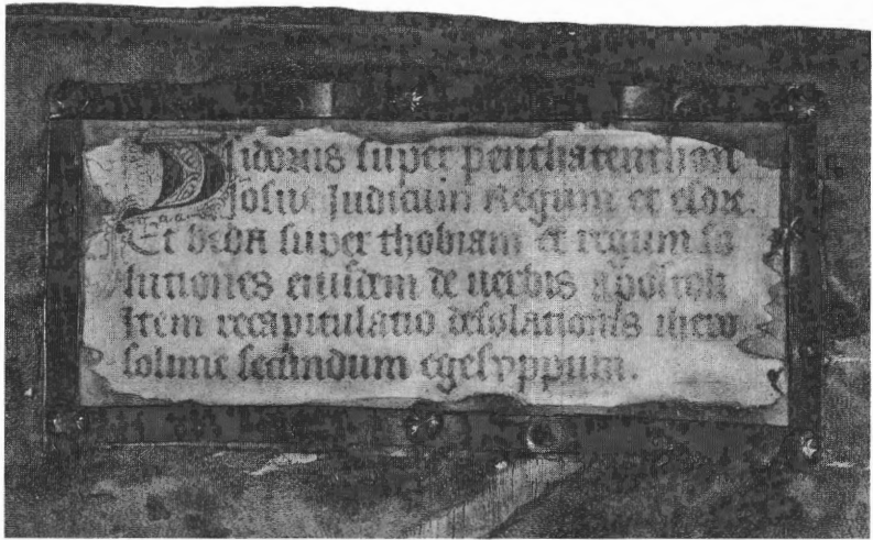
Fig. 5. Titelschild op een handschrift van Ter Doest, hand A (OB 22)

zien van een grote decoratieve kop. Deze titelschilden bevinden zich bovenaan of in de bovenhelft van het achterplat, zelden in het midden, uitzonderlijk op de onderste helft van het plat, nooit helemaal onderaan.