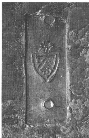
Fig. 3. Kettingklamp met het wapen van een abt van Ter Doest (OB 206)

Er is één voorbeeld van een andere dergelijke kettingklamp bekend, die volgens De Poorter het wapen van een niet-geïdentificeerde abt voorstelt. Hij komt voor op de band van een handschrift dat zeker uit Ter Doest afkomstig is 19 ; het wapen vertoont een keper, met in 1 en 2 een letter T, in 3 een krukkenkruis, het geheel bekroond met een abtsstaf.