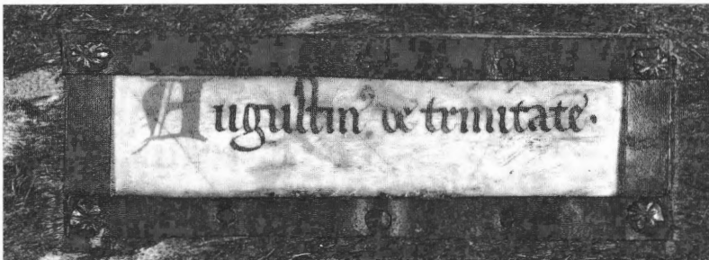
Fig. 8, 9 en 10. Titelschilden op handschriften van Ter Doest, hand D (OB 293), hand E (OB 76) en hand F (OB 113)