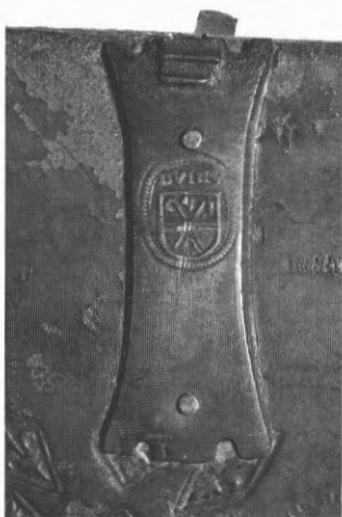
Fig. 2. Kettingklamp met het wapen van de Duinenabdij (OB 476)

Een andere, en nog merkwaardiger vorm van eigendomsmerk zijn inderdaad de kettingklampen, waarvan een paar bewaard gebleven zijn. Zoals wij nog zullen zien waren de bibliotheken van Ten Duinen en Ter Doest op een bepaald ogenblik bijna uitsluitend uit libri catenati samengesteld; de ketting, waarmee de boeken aan hun lessenaars waren vastgemaakt, werd aan de boekband bevestigd door middel van twee ongeveer rechthoekige messing plaatjes, die samen de kettingklamp vormen en met behulp van twee klinknagels doorheen het hout van het bord aan binnen- en buitenzijde van een van de platten aangebracht waren. Wij kennen vier exemplaren van een kettingklamp-helft van de Duinenabdij, waarop het wapen van de abdij en de naam Dunis in reliëf zijn aangebracht in exacte dezelfde ovale vorm, die wij ook op een paar boekbanden hebben aangetroffen 18 . Het ligt dan ook voor de hand aan te nemen, dat deze wapenstempel bedoeld was om in de kettingklampen van de Duinenhandschriften te worden geslagen, en slechts uitzonderlijk op het boekbandleder is geprent geworden.