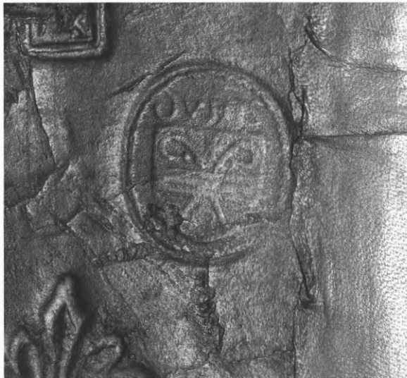
Fig. 1. Stempel met het wapen van de Duinenabdij als boekbandstempel gebruikt (OB 476)

Bepaalde eigendomsmerken werden niet in het handschrift aangebracht, maar buiten op de band. In de late Middeleeuwen, toen het gebruik om boekbanden met losse stempels in blinddruk te versieren opkwam, beschikte men in de Duinenabdij over een ovale eigendomsstempel die tussen andere stempels op de platten kon worden aangebracht. Hij vertoont het wapen van de abdij en de inscriptie Dunis . Gezien de kosten die het vervaardigen van een dergelijke stempel meebracht baart het op het eerste zicht verwondering, dat hij op niet meer dan twee bewaarde banden wordt aangetroffen 16 , terwijl toch talloze banden in hun oorspronkelijke staat tot ons zijn geko-