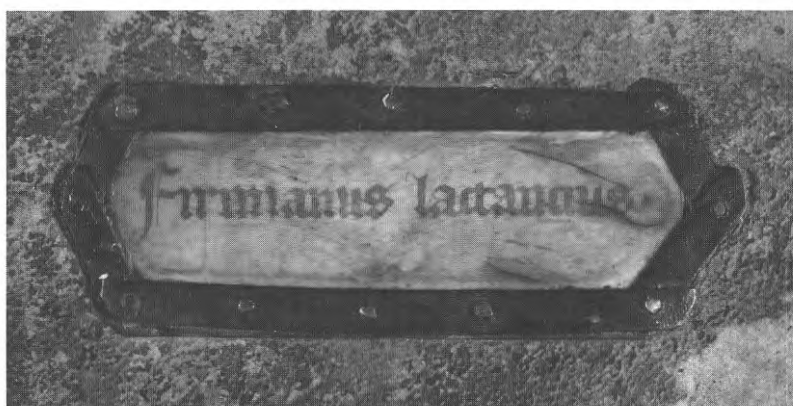
Fig. 11 en 12. Titelschilden op handschriften van Ter Doest, hand G (OB 105) en hand H (OB 166)