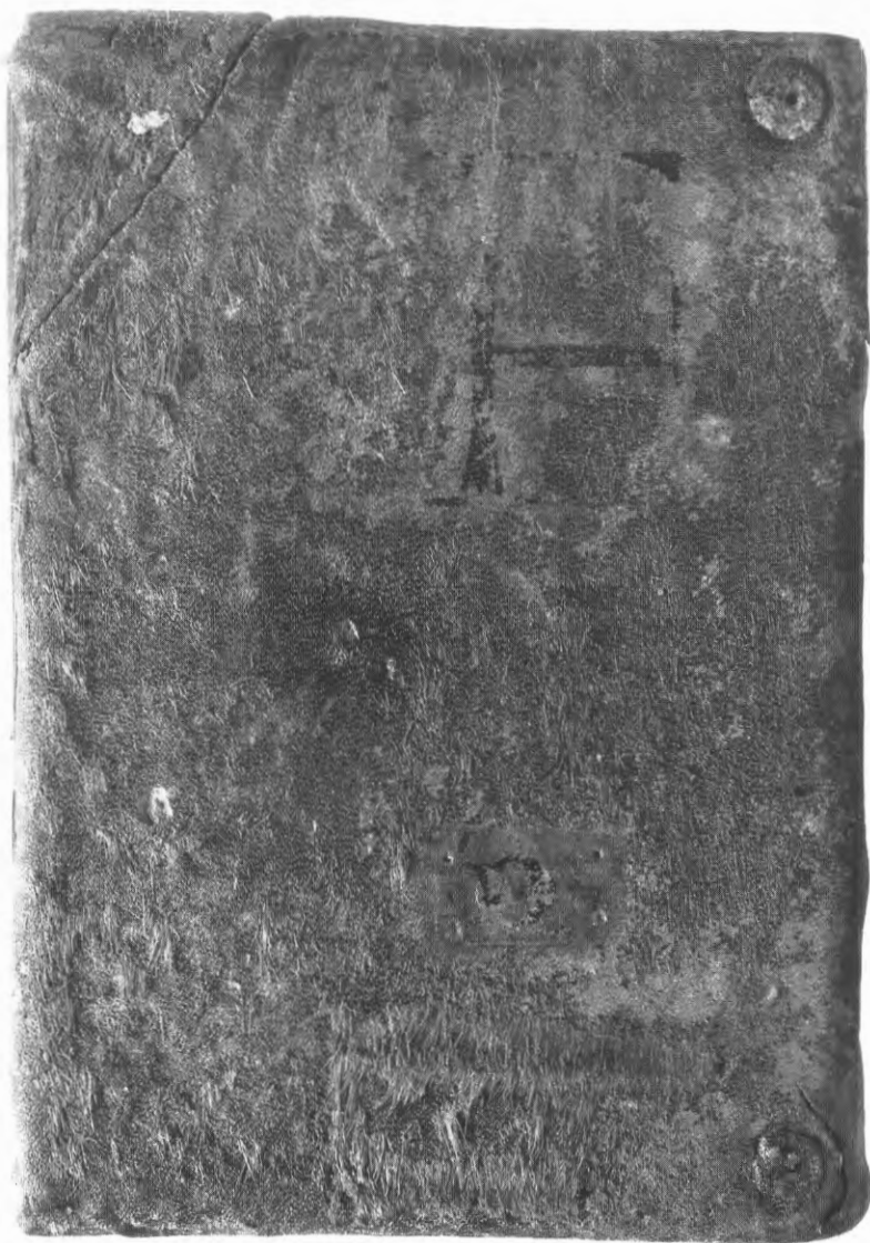
Fig. 15. Oude signatuur op een band uit de Duinenabdij (OB 102)