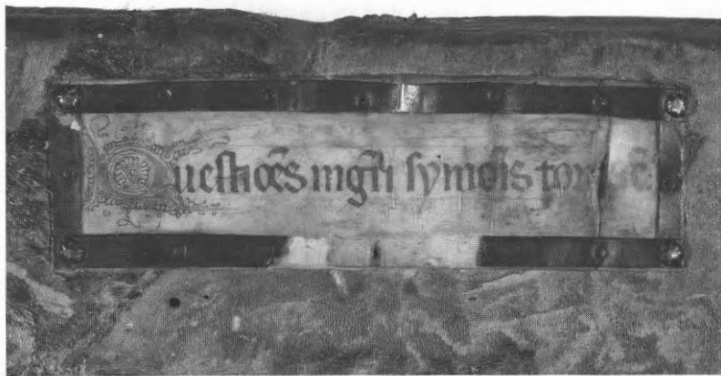
Fig. 6 en 7. Titelschilden op handschriften van Ter Doest, hand B (OB 235) en hand C (OB 193)