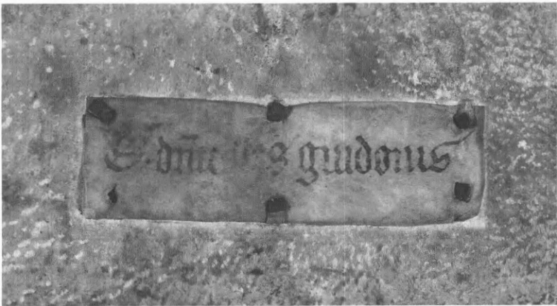
Fig. 13 en 14. Titelschilden op handschriften van de Duinenabdij, hand I (OB 490) en hand J (OB 262)

In tegenwoordigheid van twee zo contrasterende types van titelschilden, Groepen I en II enerzijds, Groep III anderzijds, is men onmiddellijk geneigd te denken dat zij de respectievelijke bibliotheekpraktijk van de twee hier behandelde abdijen weerspiegelen. De in groten getale bewaarde eigendomsmerken, mét de toeschrijvingen die wij aan de hand van de vorm van de kettingklampen kunnen doen, bewijzen meteen dat deze veronderstelling juist is, en tonen aan welke