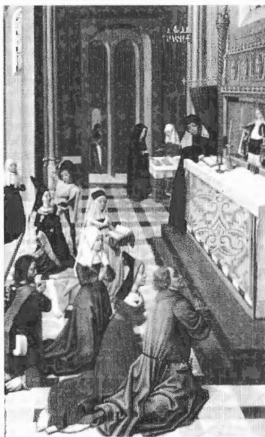
Meester van de Ursulalegende, Legende van de H. Ursula, (gedeelte)lijk. Brugge, Stedelijke Musea, Groeningemuseum