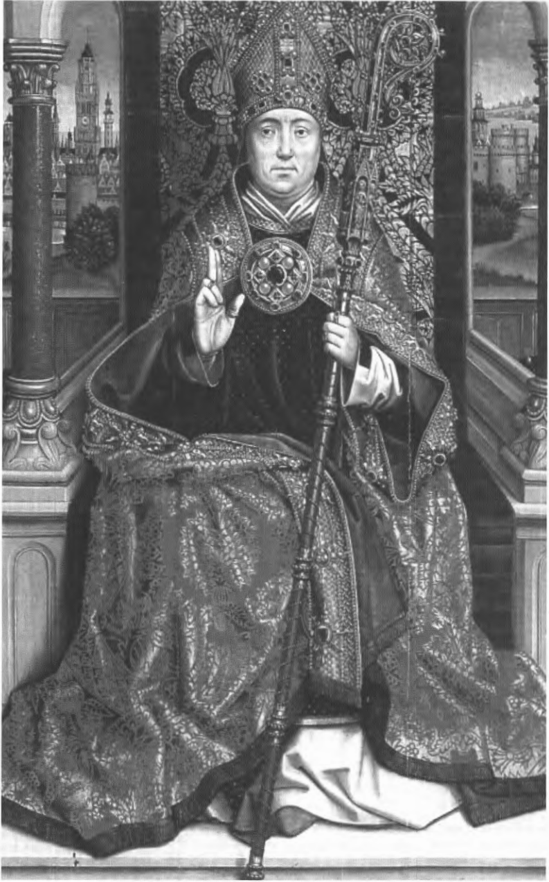
Meester van de Lucialegende, De H. Nicolaas, Brugge, Stedelijke Musea, Groeningemuseum