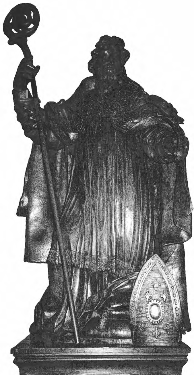
Beeld van de H. Eligius.