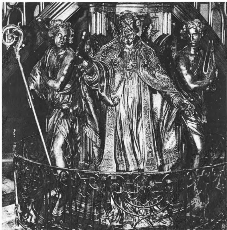
Beelden onder de kuip van de preekstoel, certijds in de Sint-Donaaskathedraal te Brugge, nu in de Sint-Bartholomeuskerk te Pollinkhove; M. Vervoort, 1715.

Met de preekstoel uit 1719 is visueel het begin van Pulinx' artistieke loopbaan enkele jaren achteruit geschoven. We zien hier nog een traditionele kunstenaar aan het werk die daarna, in enkele jaren tijd, een hele evolutie zal doormaken. Die vroege jaren 1719-1726 hebben echter hun geheimen nog niet prijsgegeven.