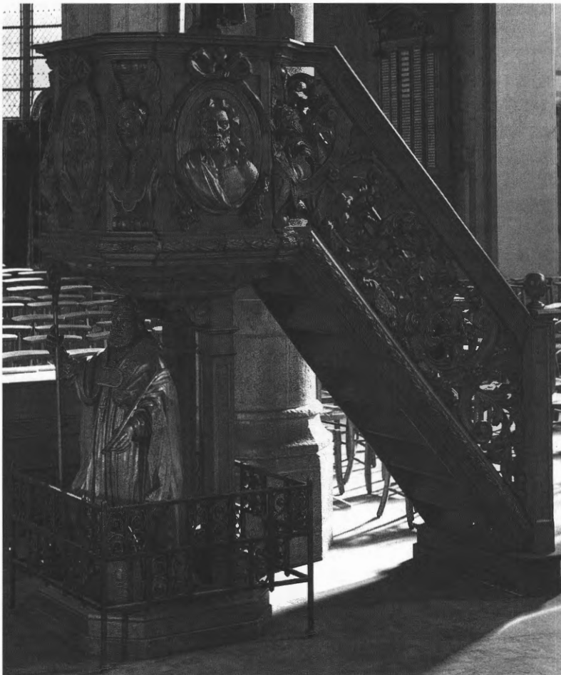
De preekstoel – zonder het latere klankbord – in de Sint-Dionysiuskerk te Geluwe (foto A.C.L. 1944).

De heilige bisschop draagt een albe, roket en koormantel; op de grond staat zijn mijter. Met de rechterhand houdt hij een (nieuwe) bisschopsstaf vast en met de linker een palmtak, wat verwijst naar zijn huidige identiteit als de bisschop-martelaar Dionysius, de 3de-eeuwse eerste bisschop van Parijs. Onderaan het beeld staat - gedeeltelijk achter de mijter - het inschrift HP.1719. De uitbeelding van de bisschopsfiguur is niet ten volle geslaagd. Onder het linkerbeen ligt een kussen; de knie is niet gebogen, maar de schoen lijkt nochtans te horen bij