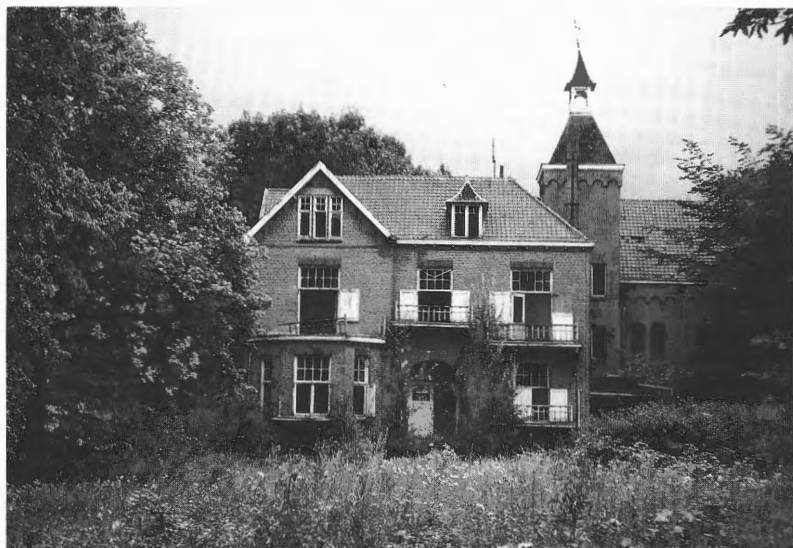
Het noviciaat van de "Soeurs de la Providence de Rouen" in zijn huidige vervallen toestand.