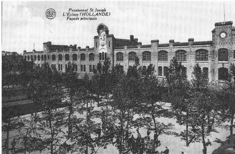
Voorgevel van het "Pensionnat Saint Joseph", nu volledig verdwenen.