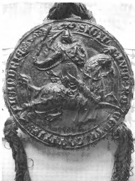
Zegel van Robrecht van Bethune, graaf van Vlaanderen. Robrecht van Bethune stuurde in 1309 zijn zoon, Robrecht van Kassel, naar Brugge om de Bruggelingen te overtuigen om het verdrag van Athis-sur-Orge te bekrachtigen. BRUGGE, Stadsarchief, Oud Archief, politieke charters , 1ste reeks, 215 (1306)