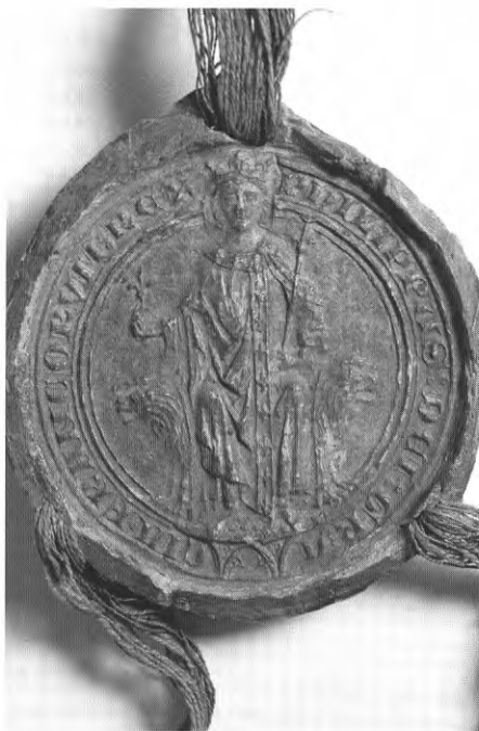
Zegel van Filips de Schone, koning van Frankrijk BRUGGE, Stadsarchief, Oud Archief, politieke charters , 1ste reeks, 230 (1309)