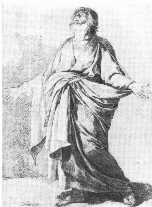
3. Joseph Benoît Suvée, Sint-Jozef , 1785, Zwart en wit krijt op blauw papier, 555 x 395 mm. Cambridge (MA), collectie Jeffrey E. Horvitz, courtesy Fogg Art Museum, Harvard University Art Museums.