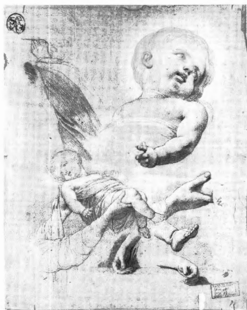
4. Joseph Benoît Suvée (vroeger toegeschreven aan J.F. Ducq), Studies van een kind , s.d., zwart en wit krijt op grauw papier, 528 x 425 mm. Brugge, Steinmetzkabinet.