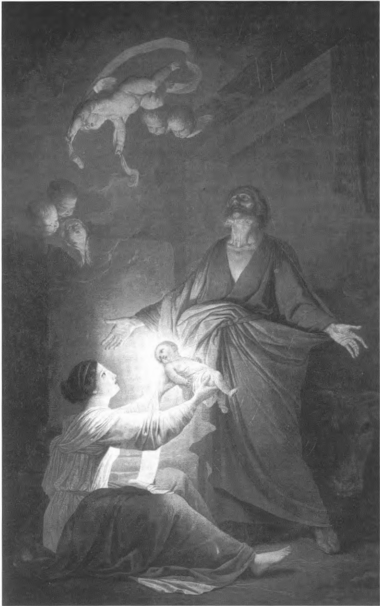
1. Joseph Benoît Suvée, De Heilige Familie of De geboorte van Christus , 1785-1791, Olieverf op doek, 75,5 x 46 cm. Brussel, Koninklijke Musea voor Schone Kunsten van België.