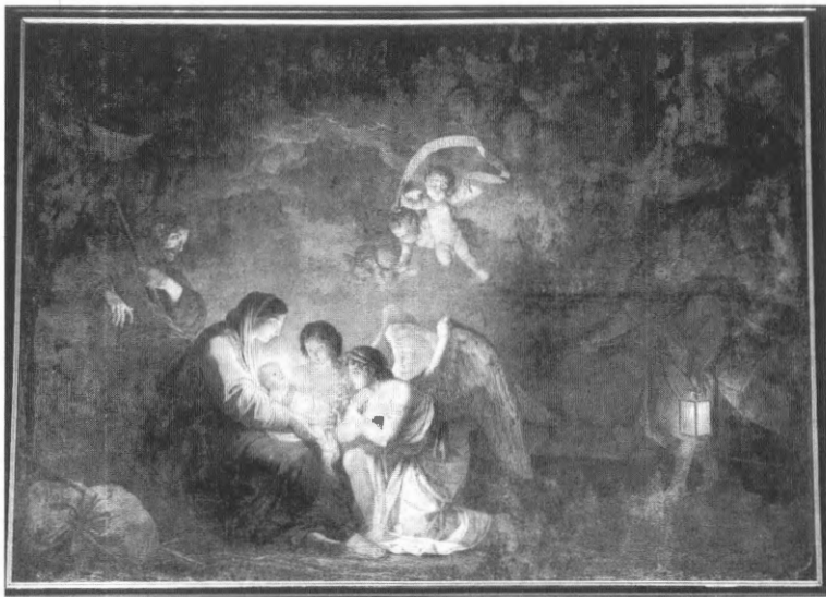
2. Joseph Benoît Suvée, Geboorte en aanbedding van de engelen , Salon 1779, olieverf op doek, 300 x 420 cm. Ieper, Sint-Martinuskerk.

boorte en aanbedding van de engelen (Ieper, Sint-Martinuskerk) (ill.2), die op het Salon te Parijs was tentoongesteld in 1779, nog een nachttafereel van Suvée dat sterk is beïnvloed door Italiaanse voorbeelden. Verder vallen het smalle en verticale formaat op, alsook de theatrale gebaren, de soepele en lineaire drapering, het suave “Griekse” profiel en de schuine achtergrond die de compositie dynamiseert. Al deze kenmerken zullen later nog meer opduiken in het werk van de kunstenaar.