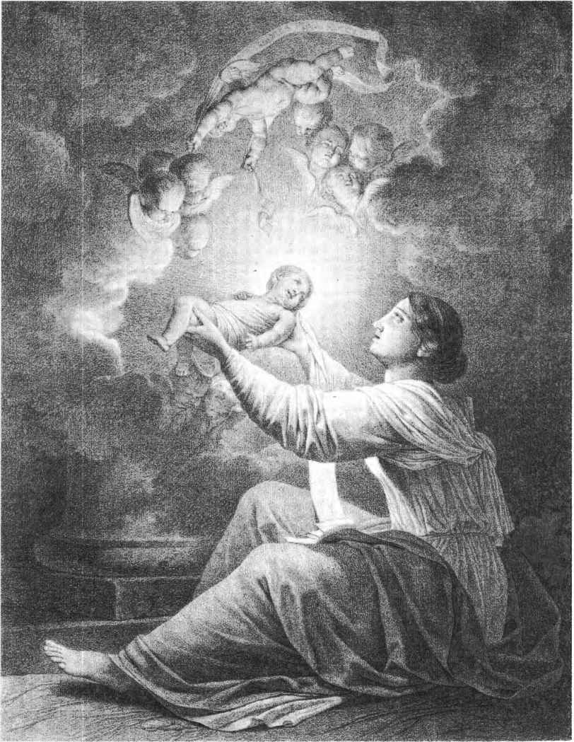
5. Joseph Benoît Suvée, Maria en Kind , 1798, zwart en wit krijt op papier, 455 x 368 mm. Cambridge (MA), collectie Jeffrey E. Horvitz, courtesy Fogg Art Museum, Harvard University Art Museums.