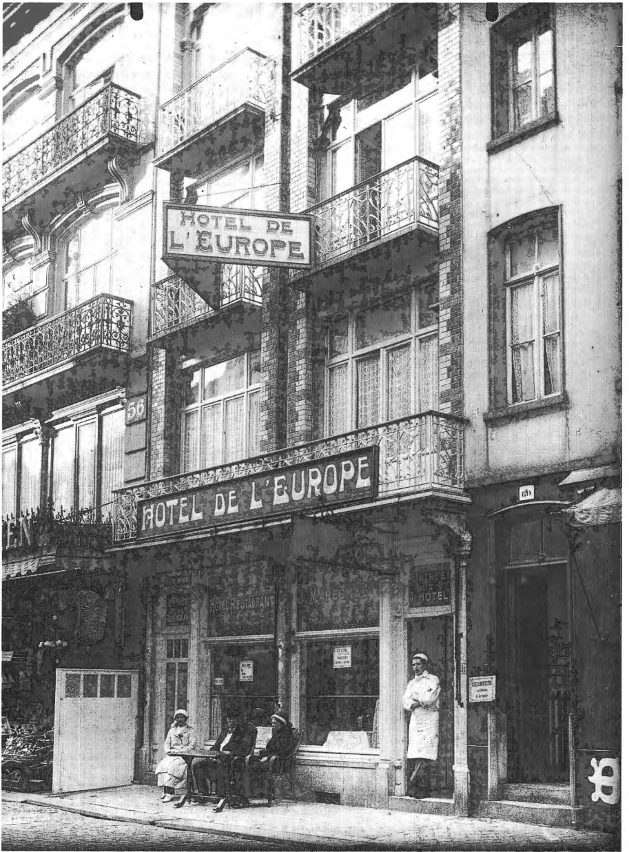
Vanaf 1895 exploiteerde J. Maréchal het Hotel de l'Europe in de Kerkstraat in Blankenberge