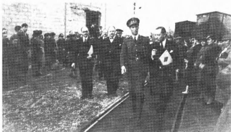
Koning Leopold III en Leon Bekaert, tijdens het bezoek aan de fabrieken in 1938.

den bij de koning. Leopold stelde uitvoerig de kritische toestand van het land voor en verzocht hem het ambt van commissaris-generaal te aanvaarden. Volgens de verweernota uit 1944 zou Bekaert bezwaar aangetekend hebben tegen het voorstel. Na een twee uur durend gesprek met Leopold aanvaardde hij het voorstel echter “omdat zijne Majesteit, als gevolg van een vraag van hem [Leon Bekaert], had laten verstaan dat hij in den grond van hem de volbrenging van deze plicht verlangde als van een soldaat in oorlogstijd”. 31 De secretarissen-generaal gingen op 5 juli echter niet akkoord met de mogelijke benoeming van Leon Bekaert. Ze dachten dat slechts een ambtenaar van de administratie of een magistraat in aanmerking kon komen voor de functie. Frédéric en Wodon, de woordvoerders van de koning, vroegen zich af waarom Bekaert niet benoemd kon worden aangezien hij toch “un homme nouveau, indépendant, sans aucune attache avec la politique ou la finance” was. De woordvoerders stelden dat zijn benoeming de enige mogelijkheid was om het bestuur in Belgische handen te houden. Uiteindelijk zwichtten de secretarissen-generaal voor de