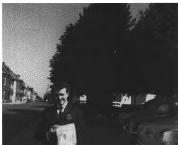
Op colportage in Izegem Begin jaren 60 van de 20ste eeuw